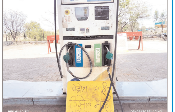
अशी मागणी त्यांनी केली. प्रशासनाचे या समस्येकडे दुर्लक्ष केल्यास नागरिकांना सोबत घेऊन तीव्र आंदोलन छेडण्यात येईल, असा इशाराही पक्षाच्या वतीने देण्यात आला आहे.