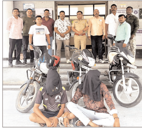
परिसरातून अज्ञात चोरट्याने लंपास केली होती. यावरून पोलिसांनी गुन्हा