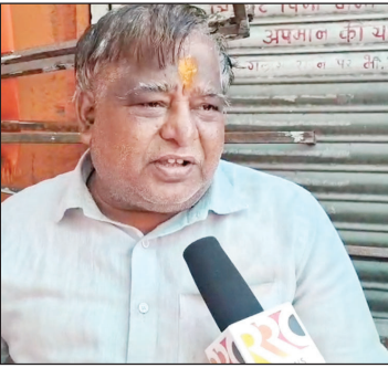
नागरिकांना प्रशासनाकडून त्वरित आणि वेळेत मदत मिळणे अपेक्षित असते. अशा बिकट परिस्थितीत