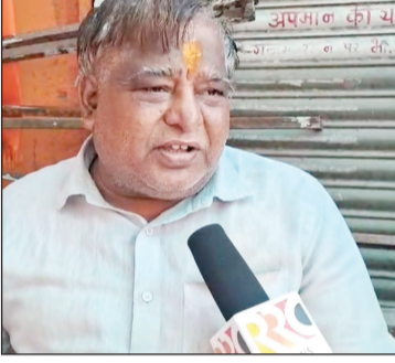
नागरिकांना प्रशासनाकडून त्वरित आणि वेळेत मदत मिळणे अपेक्षित असते. अशा बिकट परिस्थितीत