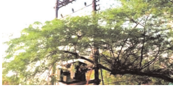
वर्दळीचा भाग असून या परिसरातून दिवसभर नागरिकांची मोठ्या प्रमाणात ये-जा सुरू असते. अशा ठिकाणी असलेले तीज रोदित्र

खामगाव: शहरातील टॉवर चौक परिसरात असलेले वीज रोहित्र झाडांच्या वाढलेल्या फांद्यांमध्ये अक्षरशः वेढले गेल्याचे चित्र दिसून येत आहे. रोहित्राच्या चारही बाजूंनी मोठ्या प्रमाणात फांद्या वाढल्याने संभाव्य दुर्घटनेची भीती व्यक्त केली जात असून, नागरिकांकडून तातडीने उपाययोजना करण्याची मागणी होत आहे.