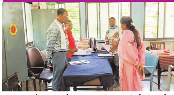
त्यावरील कार्यवाही, अभिलेखांची नोंद, कार्यालयीन उपस्थिती तसेच नागरिकांना दिल्या जाणाऱ्या विविध सेवांचा आढावा घेण्यात आला. अनेक विभागांतील नोंदवही, कार्यालयीन कागदपत्रे आणि सेवा वितरण प्रक्रियेचीही

कार्यालयीन उपस्थिती व नागरिक सेवांची माहिती