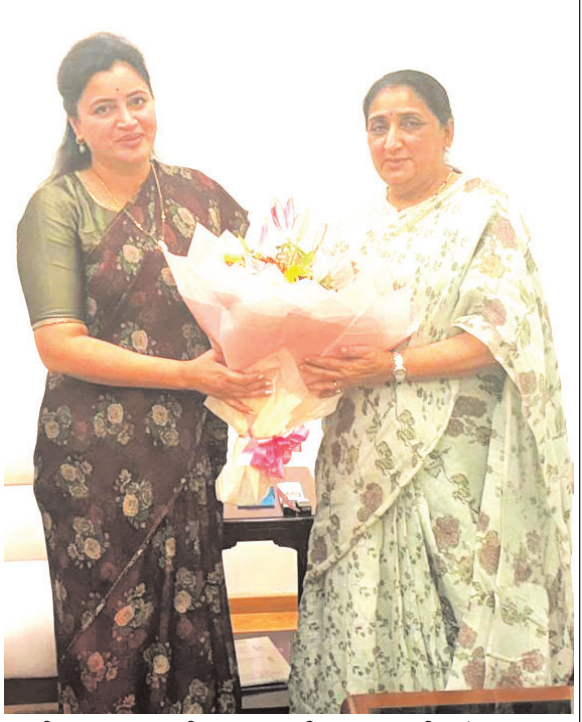
माजी खासदार नवनीत राणा यांनी उपमुख्यमंत्री सुनेत्रा पवार यांची देवगिरी निवासस्थान मुंबई येथे भेट घेतली.