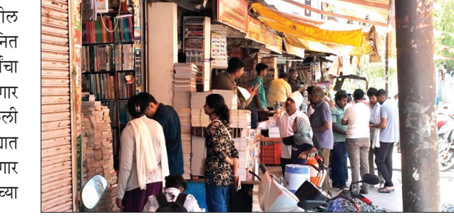
इस कोड मुळे पालकांचे बजेट कोलमडणार

◆ काही जिल्ह्यात १५ जून पासून सुरू होतील शाळा