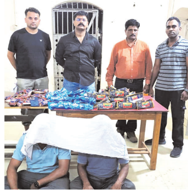
त्यानुसार ०६ चे रात्री १.३० वा पोलीस स्टेशन शिरजगाव कसबा येथील अधिकारी व पोलीस अंमलदार यांचे पथक पोस्टे हददीतमध्ये अवैध धंद्याचे विरूद्ध कार्यवाही करणे करीता तयार केले असता मिळालेल्या गोपनीय माहिती वरून करजगाव येथे पंचासमक्ष महाराष्ट्र राज्यामध्ये प्रतिबंधीत असलेला गुटखावर तेलीपुरा करजगाव येथे