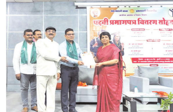
आहे. त्यानिमित्ताने विद्यापीठाने कार्यक्रम आयोजित केला होता. छत्रपती शिवाजी महाराजांच्या राज्याभिषेक दिनाचे औचित्य साधून विद्यार्थ्यांनाही पदवीदान करून त्यांचाही राज्याभिषेक करावा असे विद्यापीठाने ठरविले. शिवाजी महाराज महाराष्ट्राचे दैवत, माझे आदर्श आहेत. या राज्याभिषेक व पदवी प्रमाणपत्र