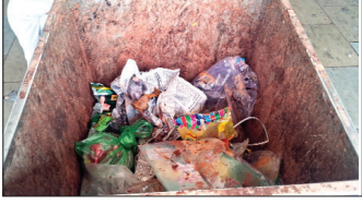
अस्वच्छतेचे साम्राज्य; पिण्याच्या पाण्यासाठी प्रवाशांची ओरड

अकोला : महाराष्ट्र राज्यमार्ग परिवहन महामंडळाच्या (एसटी) अकोला येथील कारभाराचा पुरता बोजवारा उडाला आहे. अकोला आगार क्रमांक १ आणि २ च्या परिसरात प्रशासकीय अधिकाऱ्यांच्या संगनमताने की काय, अशी शंका यावी इतक्या मोठ्या प्रमाणावर अवैध प्रवासी वाहतूक फोफावली आहे. याचा थेट फटका एसटी महामंडळाच्या उत्पन्नाला बसत असून महामंडळ तोट्यात जात असताना,