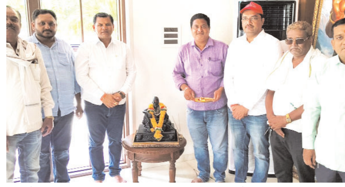
म्हणाले की, छत्रपती शिवाजी महाराजांनी स्वराज्याची स्थापना करून सामान्य जनतेला न्याय, सुरक्षा व स्वाभिमानाचे जीवन दिले. जनतेचे राज्य जनतेच्या सेवेत समर्पित करणारे आणि सर्व धर्मांचा आदर राखणारे ते एकमेव लोककल्याणकारी राजा होते. शिवरायांचे कार्य, त्यांची दूरदृष्टी, प्रशासन व्यवस्था, शौर्य आणि