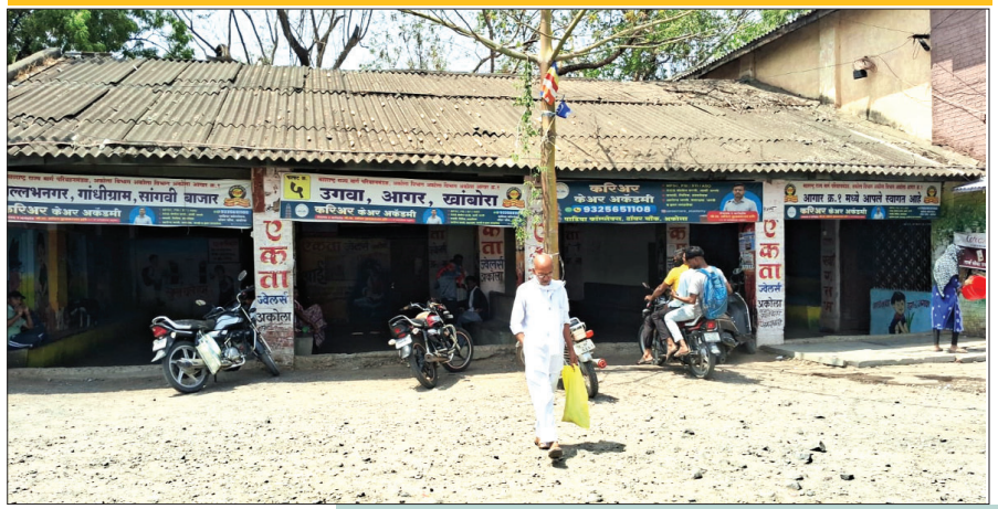
लोकप्रतिनिधीच्या 'लाडामुळे' स्वच्छतेसाठी 'जीएमसी'चा स्टाफ

►►'रापम' प्रशासनाच्या डोळ्यादेखत अवैध वाहतुकीचा सुळसुळाट! ►► विभाग नियंत्रक आणि आगार व्यवस्थापकांचे अक्षम्य दुर्लक्ष