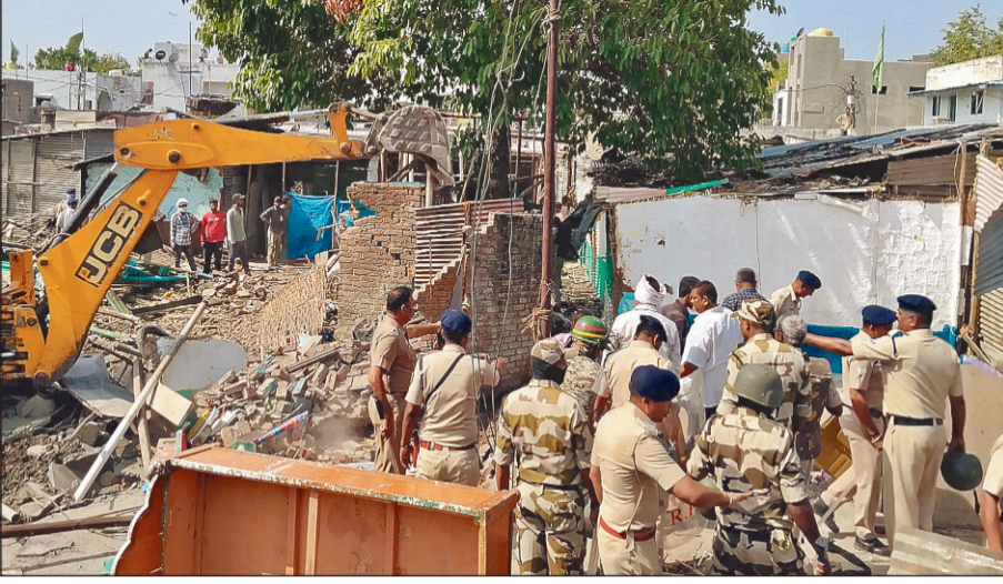
माहिती मिळाली आहे. प्रशासनाने अतिक्रमणधारकांना सकाळी १० वाजेपर्यंतची मुदत दिली होती. ही नोटीस मिळताच तार फाईल

अकोला: शहरातील तार फाईल परिसर क्रमांक ७ मधील रेल्वेच्या जागेवर करण्यात आलेल्या अनधिकृत बांधकामांवर अखेर आज, सोमवार सकाळपासून रेल्वे प्रशासनाने धडक कारवाई सुरू केली आहे. रेल्वे आणि स्थानिक प्रशासनाच्या वतीने मोठ्या बुलडोजरसह शोकडो पोलिस कर्मचाऱ्यांच्या उपस्थितीत ही कारवाई करण्यात येत आहे. रेल्वेने अतिक्रमण हटवणार असल्याचा इशारा दिल्याने आणि आता कारवाई अटळ असल्याचे पाहून अनेक नागरिकांनी स्वतःहूनच आपले अतिक्रमण काढण्यास सुरुवात केली. जवळपास १६५ घरांवर कारवाई करण्यात आल्याची