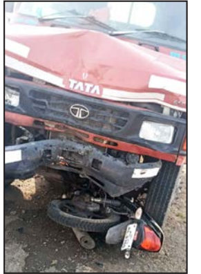
दाखल करण्यात आले आहे. दरम्यान, मृत व जखमी व्यक्तींची ओळख अद्याप पटलेली नसून

इंदिरानगर मार्गे पुसदकडे येत होत्या. त्याचवेळी मालवाहू टिप्पर (एमएच २१ बीएच ३७६०) हे वाहनही त्याच दिशेने येत होते. इंदिरानगर येथील डॅपिंग ग्राउंडजवळ टिप्परने दोन्ही दुचाकींना जोरदार धडक दिली. या भीषण अपघातात दुचाकींवरील तीन व्यक्तींपैकी दोन पुरुषांचा जागीच मृत्यू झाला, तर एक महिला जखमी झाली आहे. अपघातातून परिसरात मोठ्या प्रमाणावर नागरिकांची गर्दी जमली होती. घटनेची माहिती मिळताच पोलीसांनी तातडीने घटनास्थळी धाव घेतली. मृतदेह शासकीय उपजिल्हा रुग्णालयात हलविण्याची प्रक्रिया सुरू असून जखमी महिलेला उपचारासाठी