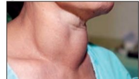
आज जागतिक थायरॉइड दिन

जगभरात थायरॉइडच्या रुग्णांची संख्या झपाट्याने वाढत आहे. या आजाराविषयी जागरूकता निर्माण करण्यासाठी दरवर्षी २५ मे रोजी जागतिक थायरॉइड दिन साजरा केला जातो. बदललेली लाइफस्टाइल आणि चुकीचा आहार यामुळे थायरॉइडचा त्रास सुरू होतो. पुरुषांपेक्षा स्त्रियांना थायरॉइडचा त्रास होण्याचे प्रमाण जास्त असल्याचे काही सर्वेक्षणांमध्ये आढळले आहे. थायरॉइडचा त्रास असल्याने शरीरातील इतर अवयवांच्या कामावर देखील परिणाम होतो. थायरॉइडचे हायपोथायराइडिजम आणि हायपरथायराइडिजम हे दोन प्रकार आहेत. जेव्हा थायरॉइड ग्रंथीमधून जास्त हार्मोन्सची थायरॉइड ही गळ्याच्या पुढच्या भागात असलेली एक फुलपाखराच्या आकाराची ग्रंथी आहे. ही ग्रंथी टी३ आणि टी४ हार्मोन्स तयार करते, जे शरीराची ऊर्जा आणि चयापचय नियंत्रित करतात. हायपरथायराइडिजम : यामध्ये थायरॉइड हार्मोन्सचे प्रमाण कमी होते. यामुळे वजन वाढणे, थकवा आणि सतत झोप येणे यांसारख्या समस्या उद्वेगतात. हायपरथायराइडिजम : यामध्ये हार्मोन्सचे प्रमाण वाढते. यामुळे वजन कमी होणे, हृदयाचे ठोके जलद पडणे आणि चिडचिड होणे अशी लक्षणे दिसतात. मुख्य लक्षण अचानक वजन वाढणे किंवा कमी होणे. सतत थकवा जाणवणे आणि केस गळणे. त्वचा कोरडी पडणे आणि महिलामध्ये मासिक पाळीत अनियमितता. मानेवर सूज किंवा गठ जाणवणे. थायरॉइड नियंत्रणासाठी काय करावे? आहारात आयोडीनयुक्त मीठ, हिरव्या पालेभाज्या आणि फळांचा समावेश करावा. नियमित व्यायाम आणि तणावमुक्त जीवनशैली ठेवावी. रक्ताची चाचणी करून डॉक्टरांच्या सल्ल्याने औषधोपचार घ्यावेत. तुम्हाला किंवा तुमच्या ओळखीतील कोणालाही थायरॉइडची लक्षणे जाणवत असल्यास, जवळील डॉक्टर किंवा हॉस्पिटलमध्ये जाऊन थायरॉइड चाचणी करून घेणे आवश्यक आहे.