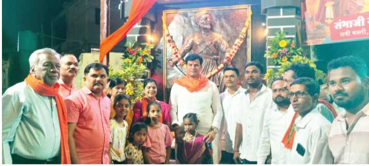
प्रतिमेस पुष्पहार अर्पण करून अभिवादन करण्यात आले.