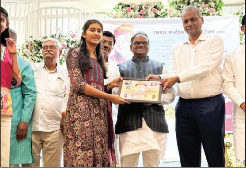
म्हणून ते बोलत होते. आपल्या ओघवत्या आणि प्रेरणादायी भाषणात खासदार डॉ.

दर्यापूर: 'देशाचा विकास करायचा असेल तर सर्वात आधी तरुणांचे चारित्र्य आणि व्यक्ती निर्माण होणे गरजेचे आहे. 'व्यक्ती निर्माण ते राष्ट्र निर्माण' हाच भारताला जागतिक महासत्ता बनवण्याचा एकमेव मार्ग आहे. जेव्हा या देशातील युवा पिढी सक्षम, सुशिक्षित आणि राष्ट्रप्रेमाने प्रेरित होईल, तेव्हाच 'समर्थ युवा, समर्थ भारत' हे स्वप्न प्रत्यक्षात उतरेल, ठ असे प्रतिपादन भारतीय जनता पार्टीचे ज्येष्ठ नेते तथा खासदार डॉ. अनिल बोंडे यांनी केले. दर्यापूर तालुक्यातील येवदा येथे 'स्वयंम मल्टीपर्वज फाउंडेशन'च्या वतीने इयत्ता दहावी आणि बारावीच्या परीक्षेत धवधवीत यश संपादन करणाऱ्या गुणवंत विद्यार्थ्यांचा भव्य सत्कार समारंभाचे आयोजन करण्यात आले होते. या ऐतिहासिक आणि अत्यंत दिमाखदार सोहळ्याला मुख्य मार्गदर्शक