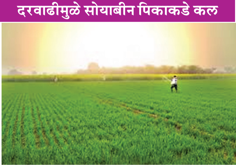
खते आणि इतर कृषी साहित्याच्या खरेदीसाठी शेतकऱ्यांनी तयारी सुरू केली आहे.

खामगाव: मागील काही दिवसांपासून सोयाबीनच्या बाजारभावात झालेल्या वाढीमुळे आगामी खरीप हंगामात जिल्ह्यात सोयाबीन लागवडीचे क्षेत्र वाढण्याची शक्यता व्यक्त केली जात आहे. चांगला दर मिळत असल्याने अनेक शेतकरी यंदा सोयाबीन पिकाकडे वळण्याचे नियोजन करत असल्याचे चित्र आहे.