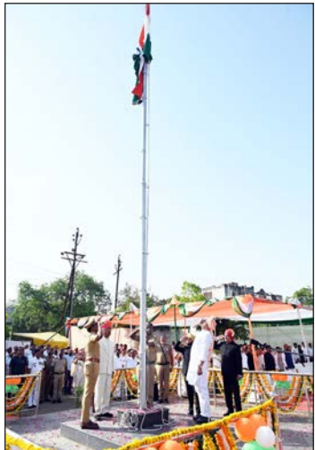
यवतमाळ : अवकाळी पावसामुळे बाधित शेतकऱ्यांसाठी साडेचार कोटी रुपयांची मदत मंजूर करण्यात आल्याची माहिती त्यांनी दिली. तसेच आतापर्यंत १.३० लाख शेतकऱ्यांना सुमारे

गेल्या काही वर्षांत कृषी, आरोग्य, शिक्षण, क्रीडा, पर्यटन आणि तंत्रज्ञान या क्षेत्रांत जिल्ह्याने प्रगती साधल्याचे सांगत राठोड यांनी पुढील काळातही विकासाकामांना गती देण्याचा निर्धार