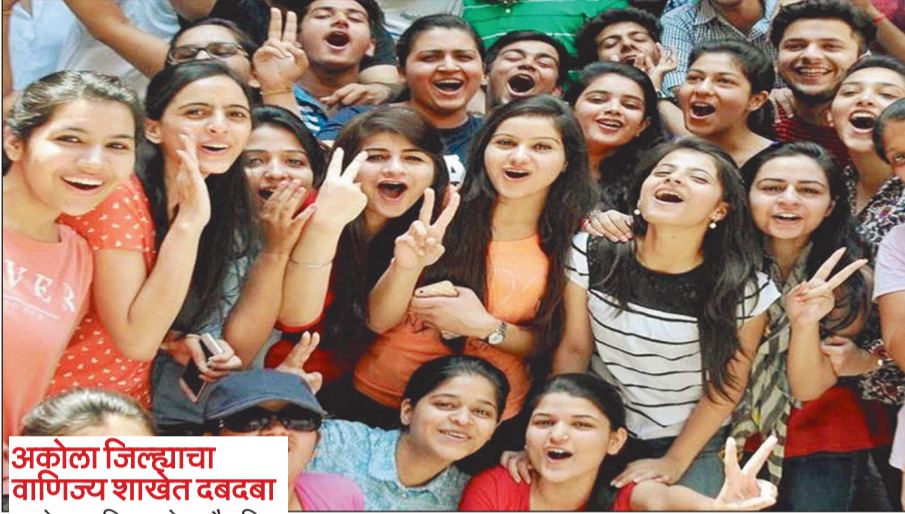
अकोला जिल्ह्याचा वाणिज्य शाखेत दबदबा

पुणे: महाराष्ट्र राज्य माध्यमिक व उच्च माध्यमिक शिक्षण मंडळाने आज इयत्ता १२ वीचा निकाल जाहीर केला असून राज्याचा एकूण निकाल ८९.७९ टक्के लागला आहे. दरवर्षीप्रमाणे यंदाही मुलींनीच वर्चस्व राखले असून, मुलींच्या उत्तीर्णतेची टक्केवारी ९३.१५ टक्के आहे, तर मुलांची टक्केवारी ८६.८० टक्के इतकी आहे. विभागीय निकालात कोकण विभाग (९४.१४ टक्के) प्रथम क्रमांकावर, तर लातूर विभाग (८४.१४ टक्के) सर्वात शेवटी आहे. विज्ञान शाखेने ९६.४४ टक्केनिकालासह आपले अव्वल स्थान कायम ठेवले आहे. यंदा निकाल लवकर लावण्यासाठी परीक्षा १० दिवस आधी घेण्यात आली होती. उत्तीर्ण विद्यार्थ्यांचे मुख्यमंत्री व शिक्षणमंत्र्यांनी अभिनंदन केले असून, अनुत्तीर्ण विद्यार्थ्यांना पुर्वणी परीक्षेसाठी शुभेच्छा दिल्या आहेत.