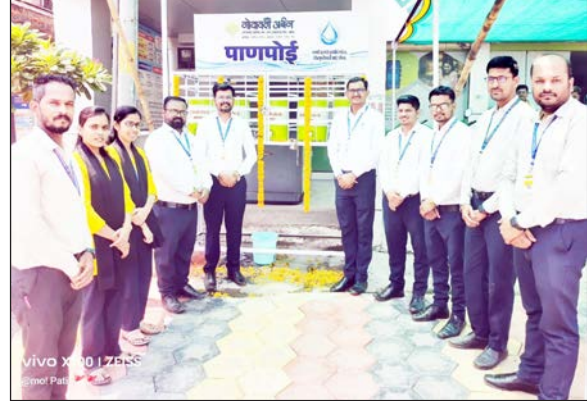
सोसायटी केवळ आर्थिक सेवा देणारी संस्था नसून सामाजिक बांधिलकी जपणारी जबाबदार संस्था म्हणून ओळखली जाते, अशी माहिती यावेळी देण्यात आली.

वाढत्या उन्हाच्या पार्श्वभूमीवर सर्वसामान्य नागरिक, ग्राहक व प्रवाशांची तहान भागवण्यासाठी हा उपक्रम राबविण्यात आला. ही