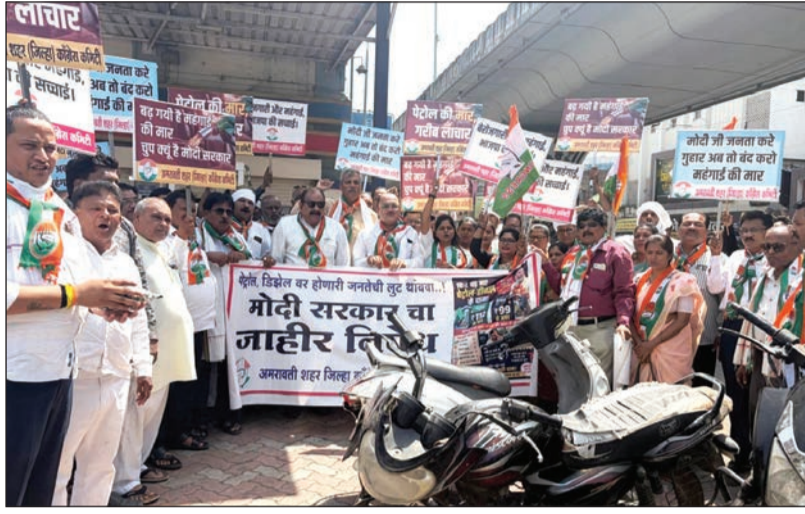
झाली आहे. हे मोदी सरकार शेतकरी, मजूर आणि मध्यमवर्गीयांच्या हालअपेष्टांकडे डोळेझाक करत आहे. केवळ उद्योगपती आणि कॉर्पोरेट मित्रांचे हित सांभाळण्यासाठी जनतेच्या खिशातून लूट चालवली जात आहे. ही अन्यायकारक, जनविरोधी आणि

अमरावती: केंद्रातील नरेंद्र मोदी यांच्या भाजप सरकारने केवळ गेल्या चार दिवसांत पेट्रोल आणि डिझेलच्या दरात तब्बल ८ रुपयांची भयंकर वाढ केली आहे. ही वाढ ही सर्वसामान्य जनतेची सरळसरळ आर्थिक लूट असून, महागाईच्या आगीत जनतेला जिवंत जाळण्याची मोदी सरकारची कुटील नीती आहे. मागील आठवड्यात इंधनाच्या किंमतीमध्ये झालेल्या प्रचंड वाढीमुळे राज्यभर महागाईचा भडका उडाला आहे. शहरांमध्ये तर ग्रामीण भागातही पेट्रोल आणि डिझेलची तीव्र टंचाई निर्माण झाली आहे. पेट्रोल पंपांवर लांबच लांब रंगा लागल्या आहेत. शहरातील नागरिकांना रोजच्या कामधंद्यासाठी इंधन मिळत नसल्याने अत्यंत कठीण परिस्थिती निर्माण