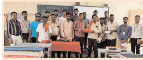
● सिटी न्यूज ब्युरो @ मंगरूळपीर ●

वाय. सी. सी. बी. एस. इ. शाळेत 'विद्यार्थी सारथी सन्मान'