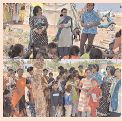
● सिटी न्यूज ब्युरो @ वाशीम ●

मागास वस्तीतील मुलींना केले मोफत सॅनिटरी पॅड वाटप