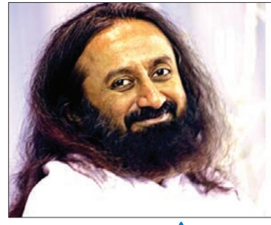
प्रतिनिधी ३ मे

अकोला : आर्ट ऑफ लिविंग संस्थेची ४५ वी वर्षपूर्ती तसेच गुरुदेव श्री श्री रविशंकर यांच्या ७० व्या जन्मदिवसानिमित्त अकोला येथे 'अनसुने दैनंदिन नायकांचा सन्मान' हा पुरस्कार सोहळा आयोजित करण्यात आला आहे.