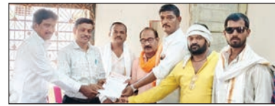
मोठ्या संख्येने विद्यार्थी शिक्षणासाठी बोर्डी व आकोट येथे दररोज प्रवास करतात. या भागात राज्य परिवहन मंडळाच्या बसेसशिवाय अन्य कोणताही

पर्याय उपलब्ध नसल्याने विद्यार्थ्यांना मोठ्या अडचणीचा सामना करावा लागत आहे. विद्यार्थ्यांचा वेळ व आर्थिक नुकसान टाळण्यासाठी तसेच शिक्षणासाठी प्रवास अधिक सोयीस्कर व्हावा यासाठी आकोट आगारातून दररोज सकाळी १० वाजता व सायंकाळी ५ वाजता आकोट ते राहणापूर बससेवा नियमित सुरू करावी.