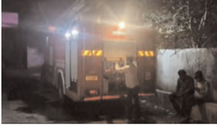
आग लागली होती. त्यावेळी शौचालय अनुदान घोटाळा मोठ्या प्रमाणात झाला होता हे सुद्धा सर्वश्रुत आहेच ! आणि सद्यस्थितीत दैनिक सिटीन्यूज सुपरफास्टने घरकुल

प्राप्त माहितीनुसार काल दि. १५ मे गुरुवारी रात्री साडे आठच्या सुमारास अचानक ही घटना घडली. सदर आगीत महत्त्वाची कागदपत्रे जळून खाक झाल्याची माहिती समोर येत आहे. तद्वतच अग्निशामक दलाच्या प्रयत्नांनंतर आग नियंत्रणात आली अन्यथा मोठा अनर्थ घडला असता अशी सर्वत्र चर्चा होत आहे. मात्र रिसोड पंचायत समितीसाठी ही आगीची घटना काही नवखी नाही. याआधी सुद्धा आस्थापना विभागाला