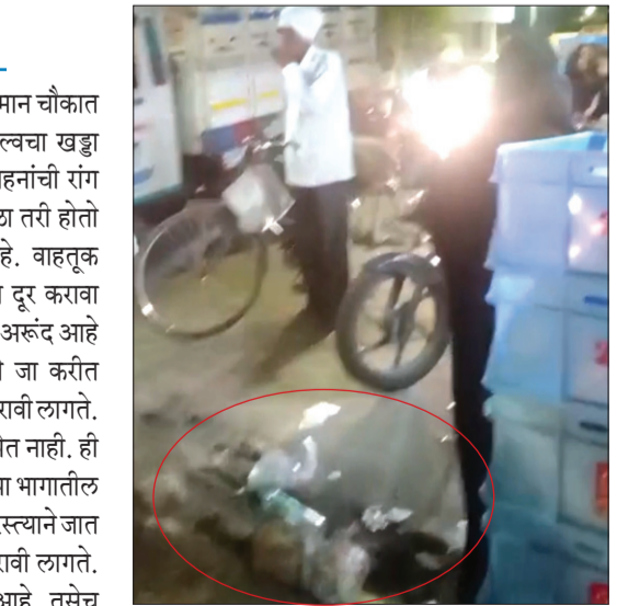
तातडीने लक्ष घावे अशी मागणी देखिल या भागातील रहिवासी तसेच शहरवासी करीत आहेत.

अकोला : अग्रवेस भागातील वीर हनुमान चौकात डेली निडसच्या बाजूला महापालिकेच्या वॉल्वचा खड्डा आहे. यामुळे वाहतूक खोळंबते. रात्री तर वाहनांची रांग लागली होती. हा प्रकार दिवसा एक दोन वेळा तरी होतो असे या भागातील रहिवाशांचे म्हणणे आहे. वाहतूक शाखेने लोकांना होत असणारा रोजचा त्रास दूर करावा अशी मागणी केली जात आहे. हा रस्ता खूप अरूंद आहे परंतु चारही दिशांनी लहान मोठी वाहने ये जा करीत असतात. त्यामुळे वाहन चालकांना कसरत करावी लागते. जॅम झाला तर पंधरा वीस मिनिटे पुढे जाता येत नाही. ही समस्या खूप जुनी आहे. आणि दिवसेंदिवस या भागातील रहदारीचा प्रश्न जाटिल होत आहे. मोठे वाहन रस्त्याने जात असेल तर वाट मोकळी होईपर्यंत प्रतीक्षा करावी लागते. या भागातील समस्या दूर होण्याची गरज आहे. तसेच खोदून ठेवलेल्या खड्ड्यामुळे निर्माण झालेली समस्या दूर करण्यासाठी महापालिकेच्या जलप्रदाय विभागाने