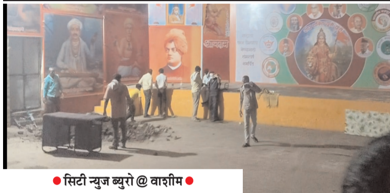
● सिटी न्यूज ब्युरो @ वाशीम ●

* पोलिसांची धाड ; ७ जण ताब्यात * 'या' टोळीत राजाश्रय असलेल्यांचा सहभाग * मेटल डिटेक्टर चा गुप्तधनाच्या शोधासाठी वापर