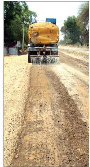
धुळीच्या रस्त्यावर पाणी टाकले जात आहे. धूळ उडणार नाही याकडे लक्ष दिले जात आहे.

हिवरखेड: हिवरखेड सोनाळा मार्गावर धुळीचा प्रवाशाना त्रास होत आहे. बांधकाम विभागाने याकडे लक्ष घावी असे वृत्त दे. सुपरफास्ट ने प्रकाशित केले. त्याचा लगेच परिणाम झाला असून रस्त्यावर टँकरने पाणी टाकले जात आहे. प्रवासी, शेतकरी, व्यापारी या सर्वांना उडणा-या धुळीमुळे त्रास सहन करावा लागत आहे. कारण रस्त्याचे डांबरीकरण जोवर होत नाही तोपर्यंत ही समस्या आहे. त्यामुळे काही तरी उपाय योजावा अशी मागणी वारंवार होत होती. अखेर यंत्रणा जागी झाली असून