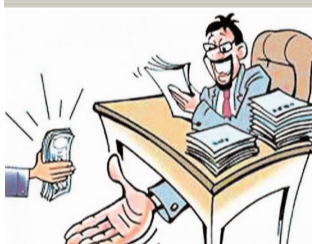
● सिटी न्यूज ब्युरो @ वाशीम ●

धक्कादायक गैरप्रकरणाची उच्चस्तरीय चौकशी करण्याची गरज