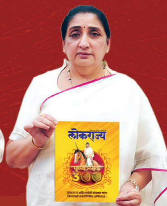
सुनेत्रा अजित पवार उपमुख्यमंत्री