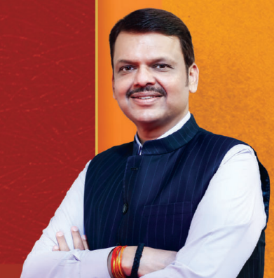
देवेंद्र फडणवीस मुख्यमंत्री