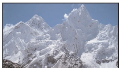
आज आंतरराष्ट्रीय एव्हरेस्ट दिन

आंतरराष्ट्रीय एव्हरेस्ट दिन हा साहस, धैर्य आणि पर्यावरण संरक्षणाचा संदेश देतो. हा दिवस माउंट एव्हरेस्टच्या ऐतिहासिक चढाईच्या स्मरणार्थ पर्वतारोहणातील मानवी यश आणि हिमालयाचे संरक्षण यावर प्रकाश टाकतो. भारताने या क्षेत्रात महत्त्वपूर्ण योगदान देत पर्वतारोहकांनी देशाचा गौरव वाढवला आहे. हा दिवस पर्यावरण जागरूकता आणि साहसी भावनेचा उत्सव आहे.