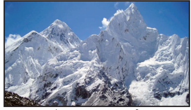
आज आंतरराष्ट्रीय एव्हरेस्ट दिन

आंतरराष्ट्रीय एव्हरेस्ट दिन हा साहस, धैर्य आणि पर्यावरण संरक्षणाचा संदेश देतो. हा दिवस माउंट एव्हरेस्टच्या ऐतिहासिक चढाईच्या स्मरणार्थ पर्वतारोहणातील मानवी यश आणि हिमालयाचे संरक्षण यावर प्रकाश टाकतो. भारताने या क्षेत्रात महत्त्वपूर्ण योगदान देत पर्वतारोहकांनी देशाचा गौरव वाढवला आहे. हा दिवस पर्यावरण जागरूकता आणि साहसी भावनेचा उत्सव आहे.