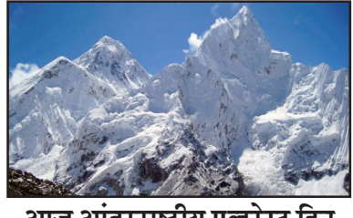
आज आंतरराष्ट्रीय एकरेस्ट दिन

आंतरराष्ट्रीय एकरेस्ट दिन हा साहस, धैर्य आणि पर्यावरण संरक्षणाचा संदेश देतो. हा दिवस माउंट एकरेस्टच्या ऐतिहासिक चढाईच्या स्मरणार्थ पर्वतारोहणातील मानवी यश आणि हिमालयाचे संरक्षण यावर प्रकाश टाकतो. भारताने या क्षेत्रात महत्त्वपूर्ण योगदान देत पर्वतारोहकांनी देशाचा गौरव वाढवला आहे. हा दिवस पर्यावरण जागरूकता आणि साहसी भावनेचा उत्सव आहे.