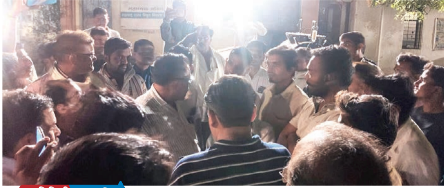
प्रतिनिधी १९ एप्रिल

हिवरखेड : येथील महावितरण कंपनी मध्ये १८ एप्रिलच्या रात्री ८ वाजताच्या दरम्यान शेकडो शेतकऱ्यांनी मोर्चा नेला, महावितरण कंपनीचे अभियंता व मोराडी