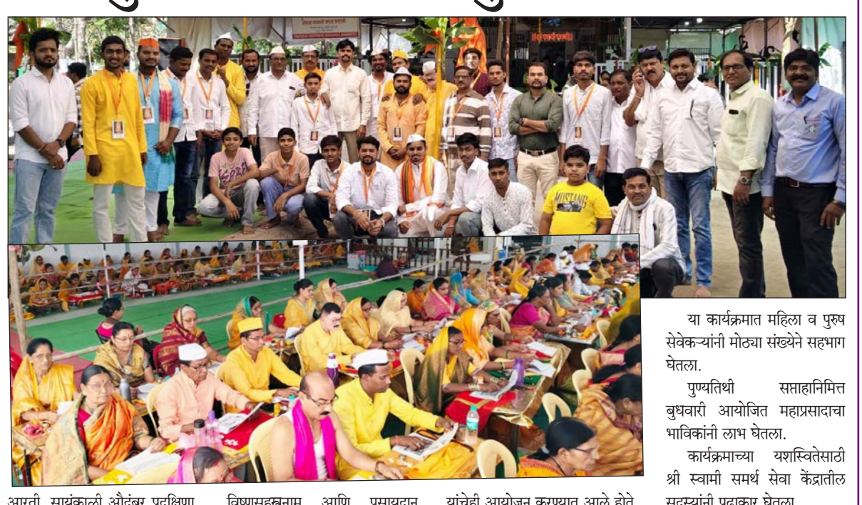
आरती, सायंकाळी औदुंबर प्रदक्षिणा, विष्णुसहस्रनाम आणि पसायदान यांचेही आयोजन करण्यात आले होते.

पुसद : शहरातील सप्तगिरी नगर येथील श्री स्वामी समर्थ सेवा केंद्रात श्री स्वामी समर्थ महाराज यांच्या पुण्यतिथीनिमित्त विविध धार्मिक कार्यक्रमांचे आयोजन करण्यात आले होते. १ ते १५ एप्रिल दरम्यान अखंड स्वामीमंत्रा जप यज्ञ सहा तसेच सामूहिक गुरुचरित्र पारायण सोहळा उत्साहात पार पडला. या सामूहिक पारायणात एकूण १६४ सेवेकऱ्यांनी सहभाग नोंदविला. सहा काळात अखंड स्वामीमंत्रा जप, विना वादन, तसेच गणेश याग, गीताई याग, चंडी याग, स्वामी याग, रूद्र याग आणि मल्हारी याग यांसारखे विविध धार्मिक विधी पार पडले. दररोज नित्यस्वहाकार, त्रिकाल