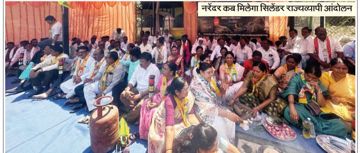
नरेंद्रर कब मिलेगा सिलेंडर राज्यव्यापी आंदोलन