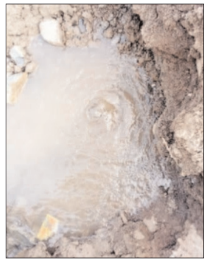
टाळण्यासाठी बांधकाम कामांदरम्यान अधिक काळजी घेण्याची गरज व्यक्त केली जात आहे.

प्रशासनाने नागरिकांना पाण्याचा काटकसरीने व योग्य वापर करण्याचे आवाहन पालिका प्रशासनाने केले आहे, तसेच दुरुस्तीचे काम शक्य तितक्या लवकर पूर्ण करून पाणीपुरवठा पूर्ववत केला जाईल, असे आश्वासनही देण्यात आले आहे. दरम्यान, अशा प्रकारच्या घटनांची पुनरावृत्ती