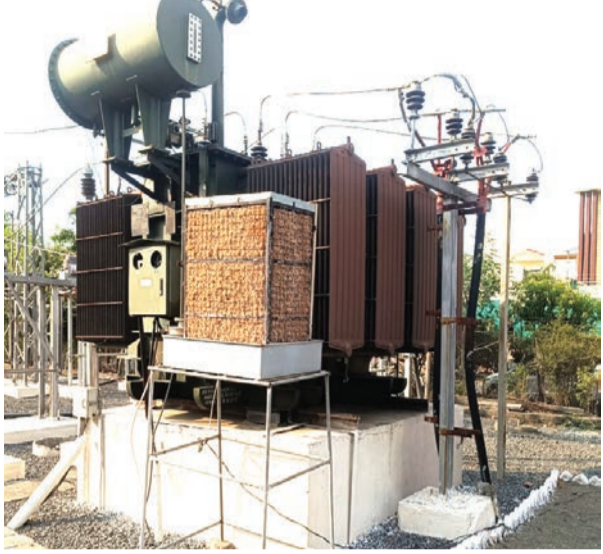
असतात. या ट्रान्सफॉर्मरची क्षमता साधारणतः ५ किंवा १० एम.व्ही.ए. इतकी असल्याने एका ट्रान्सफॉर्मरद्वारे हजारो वीज ग्राहकांना वीज पुरवठा केला जातो. या उपकरणांच्या कार्यक्षमतेसाठी

अमरावती: विशेषता परिचम विदर्भात उष्णतेची लाट पसरली असून तापमानाने ४७.६ अंश सेल्सिअसचा टप्पा ओलांडला आहे. या तीव्र उष्णतेचा परिणाम वीज वितरण यंत्रणेवर होऊ नये आणि ग्राहकांना अर्खंडित व सुरळीत वीज पुरवठा मिळावा यासाठी महावितरणने महत्त्वपूर्ण उपाययोजना सुरू केल्या आहेत. त्याअंतर्गत उपकेंद्रांतील पॉवर ट्रान्सफॉर्मर थंड ठेवण्यासाठी विशेष कुलर बसविण्यात येत आहेत.