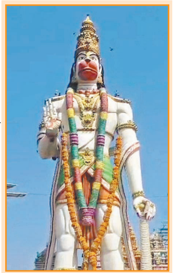
नांदुरा येथील १०५ फूट हनुमान मूर्ती समोर हनुमान जयंती उत्साहाने साजरी करण्यात आली. हजारो भाविकांनी महाकाय हनुमंताचे दर्शन घेतले. मूर्ती स्थापनेचे पंचवीसावे वर्ष असल्याने भव्य आयोजन करण्यात आले आहे. बुलडाणा जिल्ह्यातील नव्हे तर विविध ठिकाणचे भक्त दर्शनासाठी येतात. गुरुवारी सकाळ पासून भाविकांची गर्दी होती.