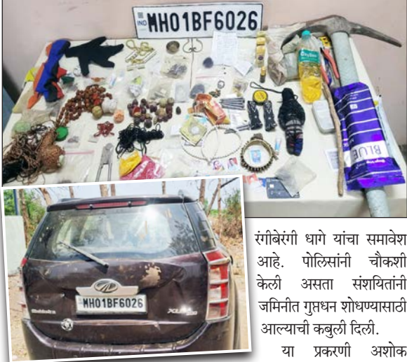
आगरवती, ज्वारांचे पोड, काळ्या कपड्यांचा बाहुल्या, त्रिशूल, रुद्राक्ष माळ, लिंबू, केस, सुया, तांबोज तसेच

यवतमाळ : गुप्तधन मिळविण्याच्या मोहात जादूटोण्याचा अवलंब करणाऱ्या सहा जणांविरुद्ध वडगाव (जंगल) पोलिसांनी कारवाई करत गुन्हा दाखल केला आहे. ही घटना २५ एप्रिलच्या मध्यासरात्री रात्रासती दरम्यान उघडकीस आली. पोलिस पथक वरुड ते कारगाव मार्गावर गस्त घालत असताना संशयास्पद स्थितीत उभी असलेली चारचाकी (एमएफ ०१ बीएफ ६०२६) आढळून आली. वाहनाची तपासणी केली असता त्यामध्ये जादूटोण्याशी संबंधित विविध साहित्य आढळून आले. जप्त साहित्यामध्ये लोखंडी साधने,