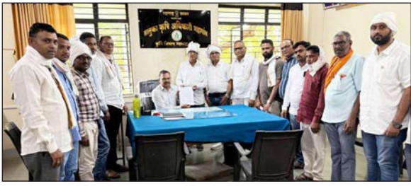
करण्यात आले. यावेळी तालुक्यातील मोठ्या संख्येने कृषी विक्रेते, संचालक व व्यावसायिक उपस्थित होते. निवेदनात व्यवसायातील विविध अडचणी, प्रलंबित मागण्या तसेच प्रशासनाकडून होत असलेल्या कार्यवाहीतील विलंब यांचा उल्लेख करण्यात आला आहे. या मागण्यांवर तातडीने निर्णय न घेतल्यास २७

महागाव : राज्यातील कृषी निविष्टा विक्री व व्यवसायासंदर्भातील प्रलंबित प्रसनांकडे कृषी विभागाकडून दुर्लक्ष होत असल्याचा आरोप करत महागाव तालुक्यातील कृषी केंद्र चालकांनी २७ एप्रिल २०२६ पासून बेमुदत बंद आंदोलन छेडण्याचा इशारा दिला आहे. महाराष्ट्र फर्टीलायझर्स पॅस्टिसाइड डीव्हिजन असोसिएशन (महाराष्ट्र राज्य) शाखा महागावच्या वतीने हा निर्णय घेण्यात आला. या पार्श्वभूमीवर २४ एप्रिल रोजी तहसीलदार तसेच तालुका कृषी अधिकारी यांना निवेदन सादर