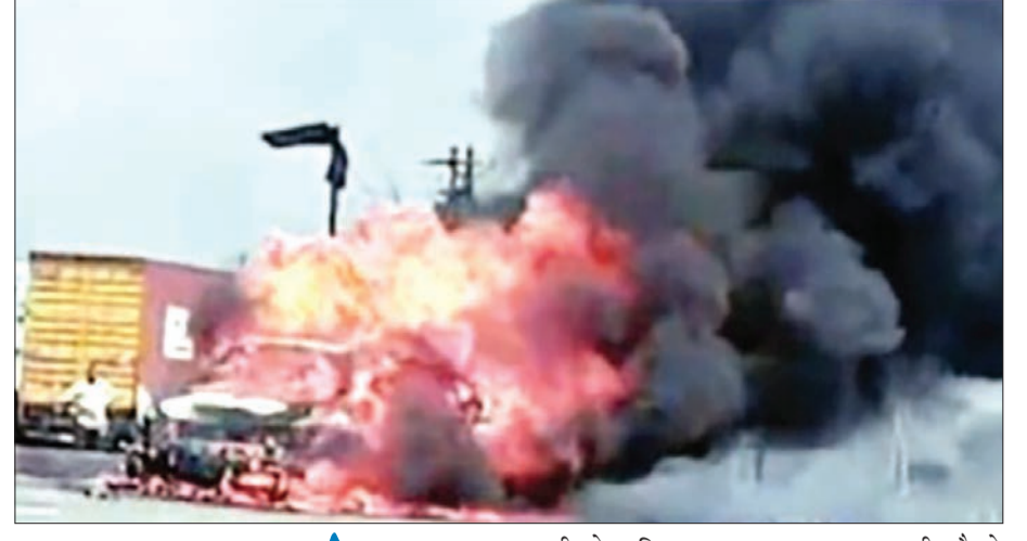
प्रतिनिधी १३ एप्रिल