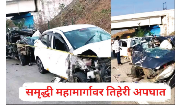
समृद्धी महामार्गावर तिहेरी अपघात

बुलडाणा : समृद्धी महामार्गावर अपघातांची मालिका सुरूच असून, काल सायंकाळी बुलडाण्याच्या मेहकरजवळ एक भीषण तिहेरी अपघात घडला. पहिल्या अपघातात मरतीसाठी धावलेल्या समृद्धी महामार्गाच्या कर्मचाऱ्यांनाच पाठीमागून येणाऱ्या भरधाव वाहनाने धडक दिली. या विचित्र अपघातात २ जण गंभीर जखमी झाले असून ५ जण किरकोळ जखमी आहेत.