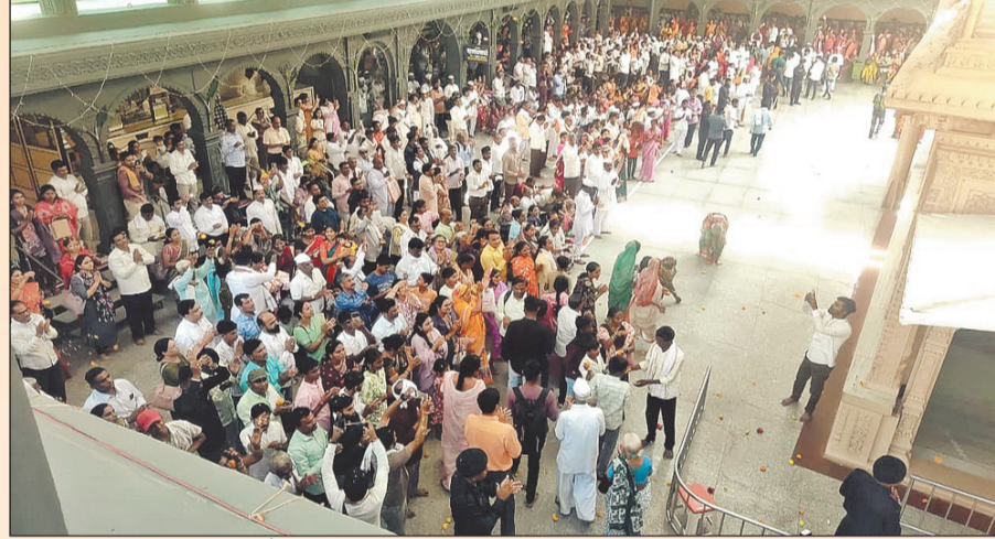
प्रतिनिधी २६ मार्च

अकोला: विदर्भाचे प्रति पंडरपूर म्हणून ओळखल्या जाणाऱ्या पावन अशा शेगाव नगरीत आज भक्तीचा एक वेगळाच कल्लोळ पाहायला मिळाला. चैत्र शुद्ध नवमीच्या पावन मुहूर्तावर,