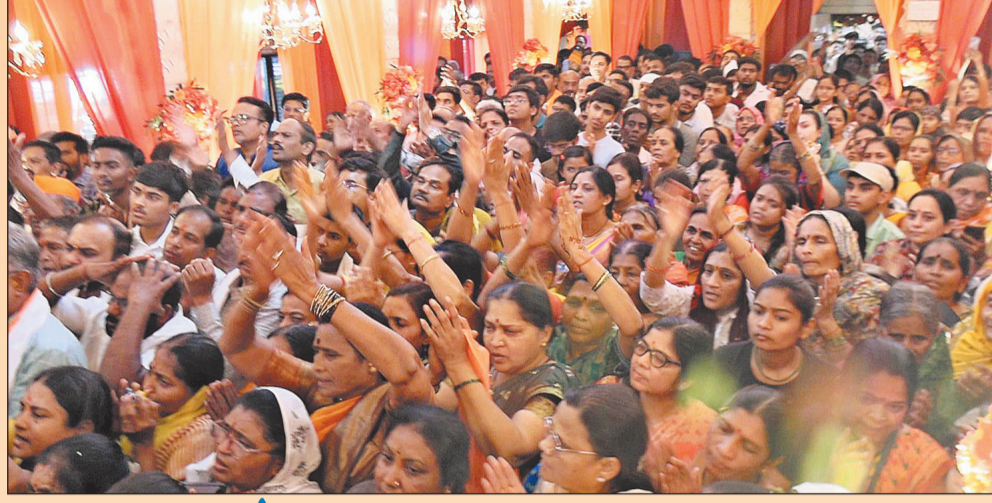
प्रतिनिधी २६ मार्च

प्रभू श्रीरामांचा जन्मोत्सव मोठ्या उत्साहात संपन्न !