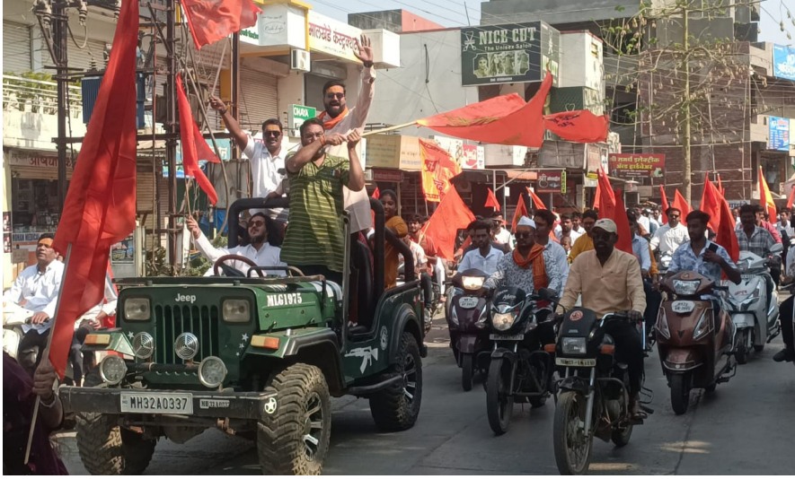
मार्गावरून ही रॅली काढण्यात आली. प्रभातफेरीचा समारोप जयहिंद चौकातील श्रीराम मंदिरात झाला. यवतमाळी श्रीरामाच्या प्रतिमेसमोर भवतांनी दर्शन घेऊन रामनवमीचा उत्सव साजरा केला.

यवतमाळ : रामनवमी निमित्त शहरात गुरुवारी पहाटेपासूनच भक्तिमय वातावरण अनुभवायला मिळाले. रामजन्मोत्सव शोभायात्रा समितीच्या वतीने मोटारसायकल प्रभातफेरीचे आयोजन करण्यात आले होते. दत्त चौकातील श्री दत्त मंदिर येथून प्रभातफेरीची सुरुवात झाली.