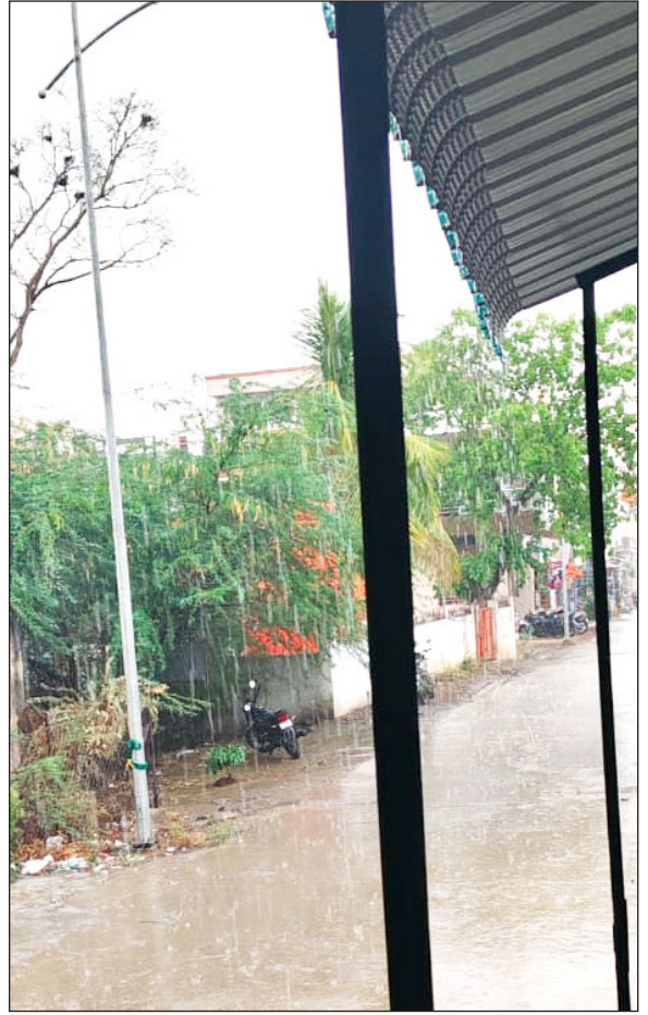
कडबा ओला झाल्याने चाऱ्याचा प्रश्नही गंभीर होण्याची भीती व्यक्त होत आहे. या अस्मानी संकटामुळे झालेल्या नुकसानीचे महसूल विभागाने तातडीने पंचनामे करून बाधित शेतकऱ्यांना भरीव आर्थिक मदत जाहीर करावी, अशी मागणी शेतकऱ्यांकडून करण्यात येत आहे.

महागाव : गेल्या काही दिवसांपासून जाणवत असलेल्या उकाड्यानंतर सोमवारी सायंकाळी महागाव तालुक्यात अवकाळी पावसानेई जोरदार हजेरी लावली. विजांच्या कडकडाटासह आणि मेघगर्जनसह झालेल्या या पावसामुळे जनजीवन काही काळ विस्कळीत झाले, तर रब्बी हंगामातील पिकांना मोठा फटका बसला आहे. दुपारपासून वातावरणात तीव्र उकाडा जाणवत होता. सायंकाळच्या सुमारास आकाशात अचानक काळे ढग दाटून आले आणि विजांच्या कडकडाटासह पावसाला सुरुवात झाली. शहरातील सखल भागांत पाणी साचले, तर ग्रामीण भागात पावसाचा जोर अधिक असल्याने अनेक ठिकाणी वीजपुरवठा खंडित झाला. या अवकाळी पावसाचा सर्वाधिक परिणाम काढणीला आलेल्या रब्बी पिकांवर झाला आहे. गहु, हरभरा तसेच भाजीपाला पिकांचे मोठ्या प्रमाणावर नुकसान झाले असून, शेतातील उभी उन्हाळी च्वारीही बाधित झाली आहे. च्वारीच्या दाण्यांची गुणवत्ता घसरून ते काळे पडण्याची शक्यता व्यक्त केली जात आहे. दरम्यान, पावसामुळे शेतकऱ्यांनी जनावरांसाठी साठवून ठेवलेला हरभरा, तूर कुटार आणि