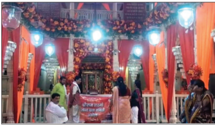
श्रीरामनवमी उत्सवात श्रीराम पंचायतन अभिषेक, दुपारी महिला मंडळाची भजन, सुंदरकांड, सईरानडे यांची नृत्य नाटका आदी कार्यक्रम होणार आहेत. गुरुवार २६ रोजी दुपारी १२ वाजता श्री राम जन्मोत्सव सोहळा

अकोला : मोठ्या राम मंदिरात श्री रामनवमी उत्सवाची जय्यत तयारी सुरू आहे. मंदिरात भजन कीर्तनाची जुनी परंपरा असून भाविक विविध कार्यक्रमात सहभागी होतात. सध्या मंदिराचे सुशोभीकरण करण्यात येत आहे. भगवे पडदे, झुमर लावले जात आहे. १९ ते २९ मार्च पर्यंत विविध कार्यक्रम आयोजित करण्यात आले आहे.