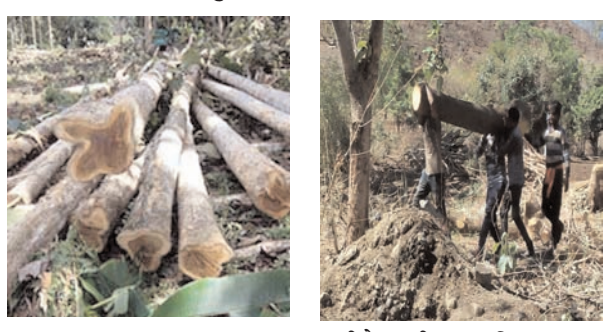
● सिटी न्यूज ब्युरो @ मानोरा ●

तालुक्यातील सह अनेक गावातील आडजात झाडे वनतस्कर शेतकऱ्यांच्या घुर्घवीवरील विकत घेऊन विना परवानगी हिरवी कच्चे झाडाची राजरोस पणे कत्तली सुरू असून याकडे वन विभागाचे अधिकारी वनपाल व वनरक्षक चिरीमिरी घेऊन याकडे दुर्लक्ष करतात. एकीकडे शासन वृक्षारोपण करीत असताना मानोरा परिसरात दररोज शेकडो वृक्षांची कत्तल होत असून दिवसा वृक्षांची कत्तल केल्या नंतर वाहनाला लाकडे टाकून नेत असताना सुद्धा ह्या तस्करकडे कोणत्या अधिकाऱ्याचे लक्ष का