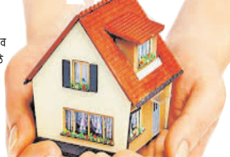
बसली आहे. घर बांधकाम

जीवनावश्यक वस्तूचे दर गगनाला भिडले. व महागाईची आग झपाट्याने पेटत आहे. त्यामुळे महागाईची झळ अजून जीवनाची कळ होत आहे. इंधन दरवाढीने जीवनावश्यक वस्तूचे दर गगनाला पोहोचले आहेत. बांधकाम साहित्याच्या दरवाढीमुळे सर्व सामान्यांचे घराचे स्वप्ने अधुरेच राहत आहेत.