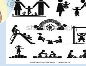
खेळणाऱ्यांचे प्रमाण जास्त झाले आहे. शहरी भागात मैदानी खेळापेक्षा इतर खेळांना आधिक महत्व दिले जात आहे. बहुतेक विद्यार्थी बुद्धीबळ करत, मोबाईलवरील ऑनलाईन खेळांकडे

तालुक्यातील पेंडू चाटोरी या ठिकाणी यात्रेनिमित्त कुस्तीचा फड मात्र दिसत आहे. अनेक ठिकाणी कुस्तीचे आखाडे पाहावयास मिळत आहेत. तालुक्यात अल्प प्रमाणात का होईना कुस्ती स्पर्धेत यात्रेच्या निमित्ताने आयोजित केलेल्या जात आहे. कबड्डी खो-खो यासारखे खेळ ग्रामीण भागात तग धरून आहे या खेळाचा प्रसारवाढीसाठी राज्य शासनाने नव्या योजना आखण्यात यासह प्रलंबित असलेल्या मैदानाचा प्रश्न मार्गी लावावा, अशी मागणी ग्रामीण भागात नागरिकांतून व्यक्त होत आहे.