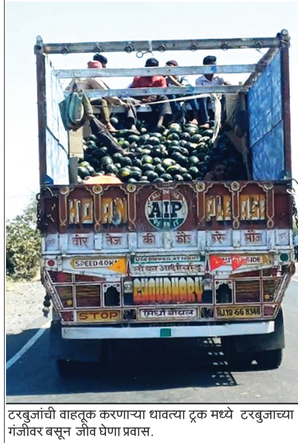
टरबुजांची वाहतूक करणाऱ्या धावत्या ट्रक मध्ये टरबुजाच्या गंजीवर बसून जीव घेणा प्रवास.