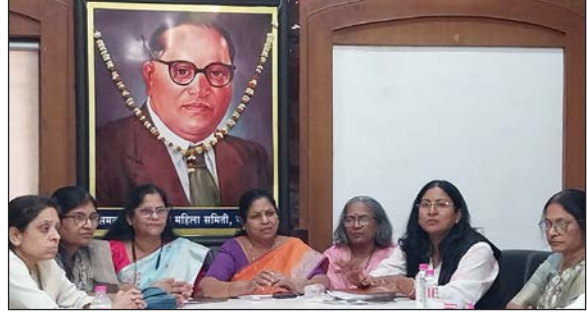
आयोजित करण्यात आली असून, "उत्सव नव्हे, अन्यायाविरुद्धचा लढा" असा संदेश यातून दिला जाणार आहे. रॅलीचा कार्यक्रम आणि मार्ग रविवारी दुपारी ठीक ४ वाजता समता मैदान येथून सुरू होणारी ही रॅली शहराच्या मुख्य मार्गावरून मार्गक्रमण

यवतमाळ : जागतिक स्तरावर खळबळ उडवणाऱ्या जेफ्री एपस्टीन बालशोषण आणि मानवी तस्करी प्रकरणातील अमानवीय सत्य समोर आल्यानंतर, यवतमाळमध्ये याचा तीव्र पडसाद उमटला आहे. प्रभावशाली गुन्हेगारांना आंतरराष्ट्रीय स्तरावर कठोर शिक्षा व्हावी आणि पीडित मुलींना न्याय मिळावा, या मागणीसाठी जागतिक महिला दिन (८ मार्च) रोजी शहरात भव्य निषेध रॅली काढण्यात येणार आहे. समस्त महिला संघटना आणि सामाजिक कार्यकर्त्यांच्या वतीने ही रॅली