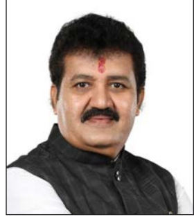
यांनी दिली. राज्याचे तत्कालीन मुख्यमंत्री एकनाथ शिंदे साहेबांनी महाराष्ट्रातील शेतकऱ्याला कर्ममुक्त करून त्याच्या घरात आनंद आणण्याचे जे वचन दिले होते, ते आज पूर्णत्वास येत आहे. 'पुण्यश्लोक अहिल्यादेवी होळकर

यवतमाळ : विधानसभेत आज सादर झालेला अर्थसंकल्प हा महाराष्ट्रातील शेतकरी, कष्टकरी तसेच लाडक्या बहिणींच्या आणि युवक, बेरोजगारांच्या कल्याणासाठीचा एक ऐतिहासिक दस्तऐवज आहे. 'महायुती' सरकारने दिलेल्या वचनांची पूर्तता करत सर्वसामान्यांच्या जीवनात आनंद आणि समृद्धी नांदवण्यासाठीचे हे एक भक्कम पाऊल आहे. हा विकसित महाराष्ट्राचा सर्वसमावेशक संकल्प आहे, अशी प्रतिक्रिया राज्याचे मूढ व जलसंधारण मंत्री तथा यवतमाळ जिल्ह्याचे पालकमंत्री संजय राठोड