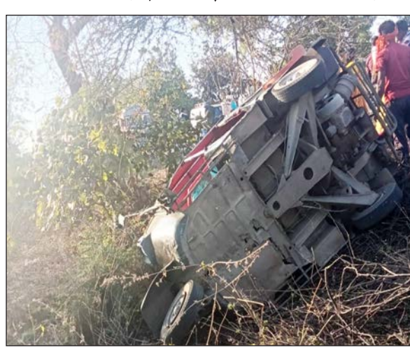
काटेरी झुडपात जाऊन पलटी झाला. या अपघातात ऑटोतील तीन प्रवासी गंभीर जखमी झाले असून काही प्रवाशांना क्रिकेटात दुखापत झाल्याची

उमरखेड : उमरखेड ते विडूळ मार्गावर तीन चाकी प्रवासी ऑटो पलटी होऊन झालेल्या अपघातात तीन प्रवासी जखमी झाल्याची घटना गुरुवारी सायंकाळी पाचच्या सुमारास घडली. शहरापासून सुमारे चार किलोमीटर अंतरावर हा अपघात झाला.