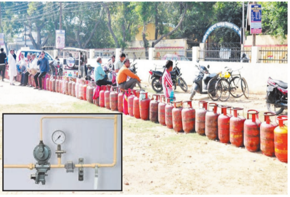
केंद्रीय पेट्रोलियम व नैसर्गिक वायुमंत्रि हरदीपसिंग पुरी यांनी शनिवारी राज्यांच्या मंत्र्यांच्या बैठकीत दिले.

वृत्तसंस्था २९ मार्च नवी दिल्ली: पश्चिम आशियातील युद्धसंकटामुळे 'एलपीजी'वर विसंबून राहता येणार नसल्याचे सांगत केंद्र सरकारने 'पीएनजी'कडे (पाइपबंद गॅस) वेगाने वाटचाल करण्याचे स्पष्ट सूतोवाच शनिवारी केले. राज्य सरकारांनी 'पीएनजी'चा अधिकधिक प्रसार करून या जोडण्या देण्यासाठी नियम व अटी शिथिल कराव्यात, असे निर्देश