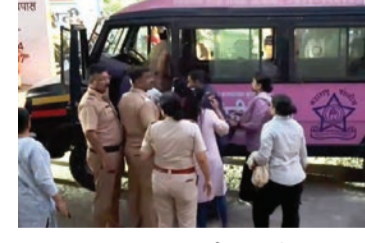
एक स्त्री घरात स्वताचे आर्थिक फायदया करिता स्त्रीयां पुरुषां त्यांचेकडून देह व्यापार करून घेते अशी खबर मिळाल्याने सदर खबरेची माहिती सहा. पोलीस आयुक्त, गुन्हे शाखा अमरावती शहर यांना देवून सदर ठिकाणाची शहानिशा करून रेड करणे कामी पोलीस स्टाफ, पंच, फंटर बोगस ग्राहक सह रवाना झाले. सदर ठिकाणी जावून खबरे प्रमाणे शहानिशा करून रेड केला असता, एक स्त्री घरात स्वताचे आर्थिक फायदया करिता स्त्रीयां पुरुषून त्यांचेकडून देह व्यापार करून घेत असताना मिळून आली व तिच्या सोबत ग्राहक आणणारा एक पुरुष मिळून आला. पिडित २ महिल्या मिळून आल्या पिडितांनी सांगितले की, वेश्याव्यवसाय

अमरावती: मंगलधाम मार्गावरील मोठ्या पुलनाजीक असलेल्या चित्रा कॉलनीत देह व्यवसाय करणारे एका महिलेच्या घरातून पोलीसांनी दोन महिला व एका ग्राहकाला ताब्यात घेतले आहे. ही कारवाई शुक्रवारी रात्री दामिनी पथक व भरोसा सेल महिला पोलीसांचे पथकाने केली आहे. या कारवाईमुळे शहरात खळबळ उडाली आहे.