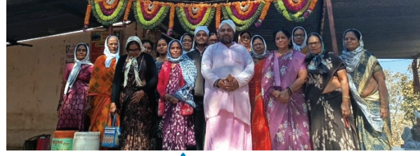
प्रतिनिधी २५ मार्च