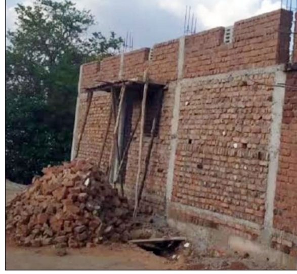
बोलले जाते. या संपूर्ण प्रकरणात तलाठी आणि ग्रामसेवक यांच्या संगनमताने संशय व्यक्त केला जात असून, मोफत रती योजनेतून काही जणांकडून आर्थिक फायदा घेतला जात असल्याची चर्चा स्थानिक स्तरावर सुरू आहे. दरम्यान, या प्रकरणाची सखोल चौकशी करून दोषींवर कारवाई करण्याची मागणी नागरिकांकडून होत आहे.

वाहनधारकांना सोयीस्कर व्यवहार करण्याची संधी दिली जात असल्याचा आरोप होत आहे. योजनेचा उद्देश मोफत रती पुरवठा असला तरी, लाभार्थ्यांकडून वाहतूक खर्चाच्या नावाखाली सुमारे ४ हजार रुपये घेतले जात असल्याचे सांगितले जाते. याशिवाय, पावतीवरील वेळेच्या फेरफारासाठी प्रति टिप ५०० रुपये घेतले जात असल्याच्या चर्चांनी जोर धरला आहे. विशेष म्हणजे, पूर्वी रती तस्करीत सक्रिय असलेले काही अनुभवी वाहनधारकच आता या प्रक्रियेत पुढे असून, ग्रामपंचायत कार्यालयांमध्ये पावत्या मिळवण्यासाठी गर्दी वाढत असल्याचे चित्र आहे. उशीर झाल्यास 'टॅक्स्टर अडकले', 'रस्ता बंद होता' अशी कारणे दाखवून पावत्या समायोजित केल्या जात असल्याचेही