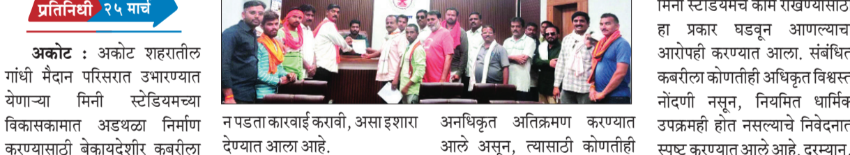
प्रतिनिधी २५ मार्च

अकोट : अकोट शहरातील गांधी मैदान परिसरात उभारण्यात येणाऱ्या मिनी स्टेडियमच्या विकासकामात अडथळा निर्माण करण्यासाठी बेकायदेशीर कबरीला 'दर्गा'चे स्वरूप देत राजकारण केले जात असल्याचा गंभीर आरोप करत तात्काळ अतिक्रमण हटविण्याची मागणी करण्यात आली आहे. यासंदर्भात नगर परिषद मुख्याधिकाऱ्यांना निवेदन देत प्रशासनाचे कोणत्याही दबावाला बळी