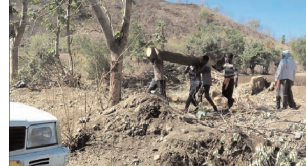
● सिटी न्यूज ब्युरो @ मानोरा ●

तालुक्यातील सह अनेक गावातील आडजात झाडे वनतस्कर शेतकऱ्यांच्या धुर्ग्यावरील विकत घेऊन विना परवानगी हिरवी कच्चे झाडाची राजरोस पणे कत्तली सुरू असून याकडे वन विभागाचे अधिकारी वनपाल व वनरक्षक चिरीमिरी घेऊन याकडे दुर्लक्ष करतात. एकीकडे शासन वृक्षारोपण करीत असताना मानोरा परिसरात दररोज शेकडो वृक्षांची कत्तल होत असून दिवसा वृक्षांची कत्तल केल्या नंतर बाहनात लाकडे टाकून नेत असताना सुद्धा ह्या तस्करकडे कोणत्या अधिकाऱ्याचे लक्ष का नाही गेल्या तीन चार महिन्या पासून वृक्षांची कत्तल होत असताना तस्करवर कारवाई होत नसल्यामुळे वरिष्ठ अधिकारी यांनी लक्ष देण्याची