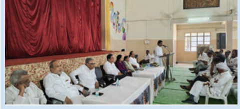
● सिटी न्यूज ब्युरो @ मंगरूळपीर ●

अकोला - वाशिम जिल्हा कार्यक्षेत्र असलेल्या जिल्हा मध्यवर्ती सहकारी बँकेच्या संचालक पदाची निवडणूक जाहीर झाली असून, यामुळे सहकार क्षेत्रातील वातावरण तापणार आहे. मात्र गत निवडणुकांप्रमाणे ही निवडणूक रंगतदार होणार की नेहमीप्रमाणे याकडे सर्वांचे लक्ष लागले आहे. २९ मार्च रोजी मतदान होणार असून ३० मार्च रोजी निकाल जाहीर होणार आहे. अकोला वाशिम जिल्हा कार्यक्षेत्र असलेल्या जिल्हा मध्यवर्ती सहकारी बँकेचा नावलीक संपूर्ण महाराष्ट्रात आहे. ही बँक आर्थिक दृष्ट्या प्रगतीपथावर असून कर्ज वितरण व अन्य वित्तीय सेवांमध्ये अग्रेसर आहे म्हणूनच अनेक वर्षांपासून या बँकेवर सहकार पॅनलची सत्ता आहे. या जिल्हा बँकेची निवडणूक सहकार विभागाकडून जाहीर झाली असून १० टिकाणी संचालक मंडळ अविरोध निवडून आले आहे तर इतर ११ टिकाणी येत्या २९ मार्चला निवडणूक होणार असून ३० मार्चला मतमोजणी होणार आहे. या पार्श्वभूमीवर मंगरूळपीर येथील सांस्कृतिक भवनात ता. २२ रोजी तालुक्यातील विविध सहकारी सोसायटीच्या अध्यक्षांचा मेळावा आयोजित केला होता.