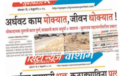
● अर्धवट काम मोक्यात, जीवन धोक्यात!

सदर पुलाची काही दिवसांपूर्वी दुरुस्ती करण्यात आली होती. मात्र दुरुस्ती पूर्ण झाल्याचा दावा करण्यात आला असतानाही पुलावर आवश्यक असलेले सुरक्षा कठडे बसविण्यात आले नव्हते. पुलाच्या दोन्ही बाजूंना अंदाजे १० ते १५ फूट खोल उतार असल्याने वाहन घसरल्यास येथे नाल्यात कोसळण्याचा गंभीर धोका निर्माण झाला होता. त्यामुळे हा पूल अपघाताला आमंत्रण देणारा ठरत असल्याची स्थिती निर्माण झाली होती. जालना-पुलागाव हा महत्त्वाचा राष्ट्रीय महामार्ग असून या मार्गावरून दररोज दुचाकी, चारचाकी, ट्रॅक्टर तसेच शेतमाल वाहतूक मोठ्या प्रमाणात सुरू असते. परिसरातील शेतकरी, व्यापारी तसेच प्रवासी यांच्यासाठी हा मार्ग अत्यंत महत्त्वाचा आहे. मात्र एवढ्या वर्दळीच्या मार्गावर मूलभूत सुरक्षा उपाययोजना न करता