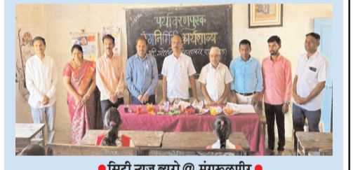
● सिटी न्यूज ब्युरो @ मंगरूळपीर ●