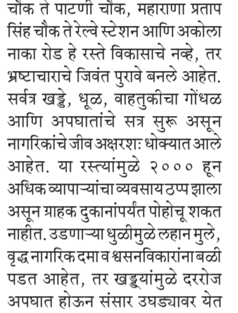
आहेत. तरीही स्थानिक राजकीय नेते