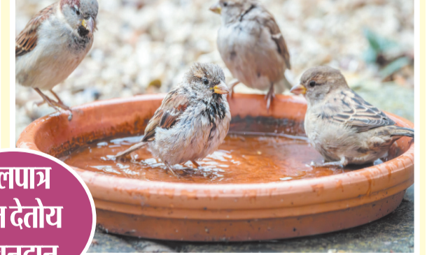
जलपात्र ठेवून देतोय जीवनदान