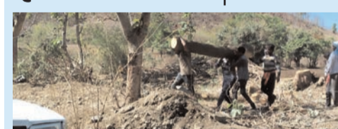
●सिटी न्यूज ब्युरो @ मानोरा●

तालुक्यातील सह अनेक गावातील आडजात झाडे वनतस्कर शेतकऱ्यांच्या धुर्धुरी वीरल विकत घेऊन विना परवानगी हिस्वी कच्चा झाडाची राजरोस पणे कत्तली सुरू असून याकडे वन विभागाचे अधिकारी वनपाल व वनरक्षक चिरीमिरी घेऊन याकडे दुर्लक्ष करतात.