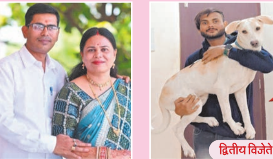
माझ्या अस्तित्वाची ओळख आणि संसाराचा आधार म्हणजे तुम्ही. कडक शिस्तीचा बाप, तर कधी चुका पोटात घेणारी आई झालात. शब्दांविषयी माझं मन वाचणारं तुम्ही माझं हक्काचं आभाळ आहात. तुमच्या प्रेमाची ओढ ही केवळ भावना नाही, तर माझ्या जगण्याचं बळ आहे. हेमंत शर्मा, अकोला.