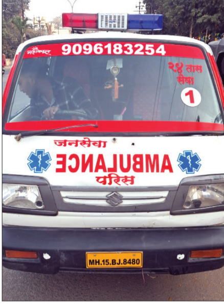
असलेल्या शहरात अॅम्बुलन्स चालकांची लुट आणि अरेवारी ही अकोल्याचे नाव बदनाम करत आहे.

अकोला : रुग्णांना जीवनदान देण्यासाठी असलेली अॅम्बुलन्स सेवा अकोला शहरात आता सामान्यांसाठी दहशतीचा आणि लुटीचा अड्डा बनली आहे. शहरात अॅम्बुलन्स चालकांकडून नियमांची पायमल्ली होत असताना आरटीओ आणि शहर वाहतूक शाखा मात्र डोळे झाकून बसली आहे का? असा संतप्त सवाल आता अकोलेकर विचारत आहेत. तर या यंत्रणेचा आशिर्वादातून हे सर्व होत आहे काय असा प्रश्न उपस्थित होत आहे. थेट लाल दिव्यांचा गैरवापर करत शहरात सायरन वाजवत फिरणाऱ्या अॅम्बुलन्स कोणाच्या असा प्रश्न उपस्थित होत असून रुग्ण नसताना रस्त्याने जाणाऱ्या सामान्य नागरिकांमध्ये भिती निर्माण करणाऱ्या अॅम्बुलन्स चालक व मालकांवर गुन्हा दाखल करण्याची गरज आहे. पण, पोलिस प्रशासन आणि आर टी ओ यांचे आर्थिक लागेबंध आणि आशिर्वाद यामुळे अकोलेकरांना नाहक त्रास सहन करत जगावे लागत आहे. अकोला हे एज्युकेशन हब असताना मेडिकल हब देखील आहे. मेडिकल हब