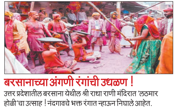
बरसानाच्या अंगणी रंगांची उधळण ! उत्तर प्रदेशातील बरसाना येथील श्री राधा राणी मंदिरात 'लठमार' होळीचा उत्साह ! नंदगावचे भक्त रंगात न्हाऊन निघाले आहेत.