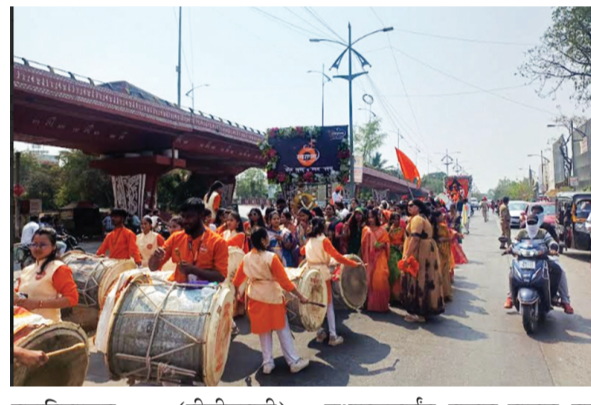
महाविद्यालय (पीडीएमसी) सभागृहापर्यंत वाजत-गाजत पार

अमरावती : छत्रपती शिवाजी महाराज जयंतीनिमित्त डॉ. पंजाबराव देशमुख विधी महाविद्यालय येथील विद्यार्थिनींनी मोठ्या उत्साहाने दिमाखदार रॅली काढली. शिवायांच्या पूर्णाकृती पुतळ्यासह निघालेली ही रॅली विधी महाविद्यालयापासून डॉ. पंजाबराव देशमुख वैद्यकीय स्मृती