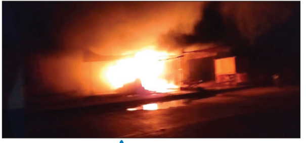
प्रतिनिधी १८ फेब्रुवारी

अकोला : शहराजवळील घुसर नजीक आदिकेश मुळे यांच्या दुचाकी दुरुस्तीच्या गॅरेजला काल रात्री साडेबाराच्या सुमारास अचानक आग लागल्याने गॅरेज मधील संपूर्ण साहित्य जळून खाक झाले. गॅरेज