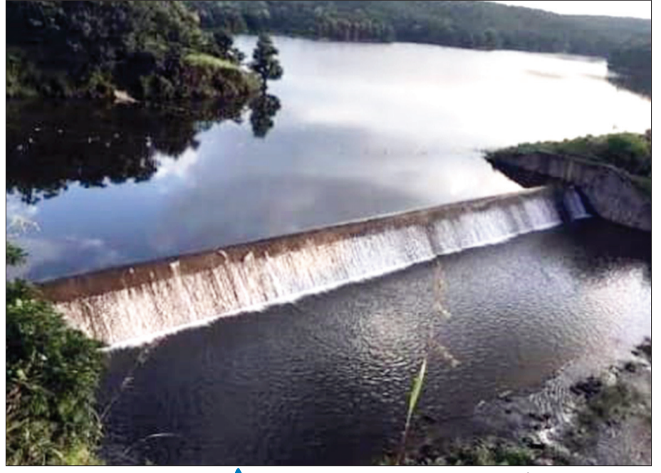
प्रतिनिधी १८ फेब्रुवारी

पातुर : पातुर तलाव शंभर टक्के भरला आहे. परंतु कालवा दुरुस्त न केल्यामुळे अडीचशे हेक्टर शेती सिंचनापासून वंचित आहे. या तलावामुळे आसपासच्या क्षेत्रातील शेतकऱ्यांना सिंचनासाठी पाणी मिळणे अपेक्षित होते, परंतु कालव्याच्या दुरुस्तीच्या अभावामुळे शेतकऱ्यांना निराशा झाली आहे.