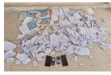
● सिटी न्यूज ब्युरो @ वाशीम ●