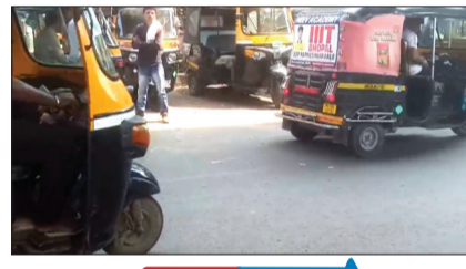
प्रतिनिधी १८ फेब्रुवारी

अकोला : शहरातील वाहतूक व्यवस्थित राहण्यासाठी सिग्नल शिवाय दुसरा मार्ग नाही. अन्यथा वाहने मनमर्जीने धावतात. कसलाही पायबंद राहत नाही. काही दिवसांपासून शहरातील सिग्नल बंद राहतात. मध्यंतरी वाशीम बायपास चौकातील सिग्नल दुरुस्ती झाली. तर मंगळवारी महाराजा अप्रसेन चौकातील सिग्नल बंद होते. त्यामुळे वाहने मनाला वाटेल तशी धावत होती.