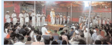
●सिटी न्यूज ब्युरो @ मंगरूळपीर●