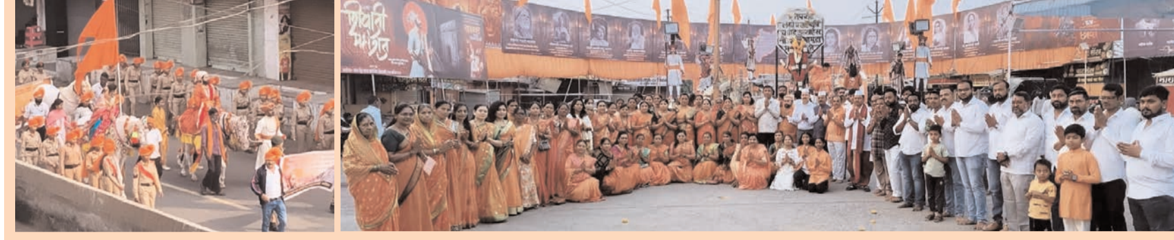
●सिटी न्यूज ब्युरो @ वाशीम●

*सार्वजनिक शिवजयंती महोत्सव * रक्तदान शिबिर, सद्भावना रॅलीसह ठिकठिकाणी विविध उपक्रम