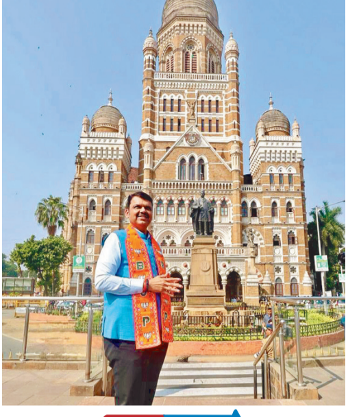
प्रतिनिधी ११ जानेवारी

लाडक्या बहिणींना बेस्टमध्ये 50 टक्के सवलत महायुतीकडून मुंबईकरांसाठी घोषणांचा पाऊस