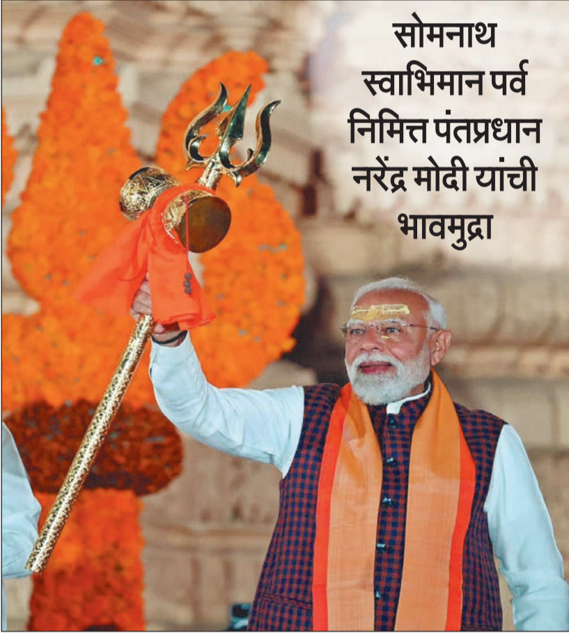
सोमनाथ स्वाभिमान पर्व निमित्त पंतप्रधान नरेंद्र मोदी यांची भावमुद्रा