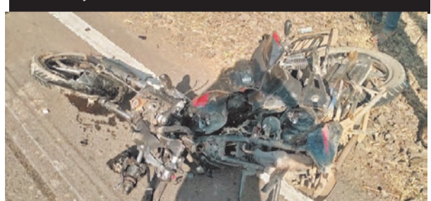
प्रतिनिधी ११ जानेवारी

प्रतिनिधी हिवरखेड: तेलहारा मार्गावरील गोरधा फाट्या जवळ कारने हिंगणी येथील शेतकरी पुत्र मोटारसायलने जात असता त्याला जबर धडक दिली. या घटनेत युवक जागीच ठार झाला. मृतक अधिन कोरडे हिंगणी येथील असल्याची माहिती आहे. घटनास्थळवरून