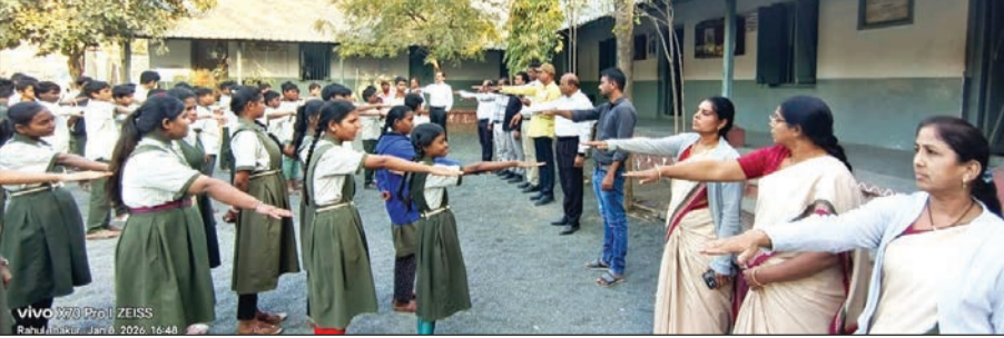
शाळापरिसरांमध्ये मतदान जनजागृती करण्यात आली आहे. या रॅलीच्या माध्यमातून नागरिकांमध्ये मतदानाचे महत्त्व, लोकशाहीतील सहभाग आणि जबाबदार मतदाराची भूमिका याबाबत जागृत करण्यात येत आहे. आजच्या जनजागृती रॅलीमध्ये महानगरपालिका