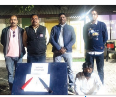
प्रतिनिधी ९ जानेवारी

निवड करण्यात आली आहे. योजनेमुळे शेत रस्त्यांवरील अतिक्रमणे दूर होऊन शेतकऱ्यांचा माल बाजारपेठेपर्यंत नेणे अधिक सुलभ होणार आहे. शेतरस्ते मोकळे करणे आणि जल पुनर्मरणासाठी हा प्रकल्प राबवण्याचा निर्णय घेण्यात आला आहे. या योजनेतर्गत जिल्ह्यात बारामाही शेत रस्ते तयार करण्यात येणार आहे. पाणंद रस्त्यांसाठी पाच किलोमीटरच्या आतील नदी व नाल्यांमधील गाळ व साहित्याचा वापर केला जाणार आहे. हे साहित्य स्वयंसेवी संस्थांना मोफत उपलब्ध करून देण्यात येणार आहे. यामुळे जलस्रोतांचे खोलीकरण होऊन पाणी पातळी वाढण्यास मदत होणार आहे.