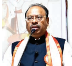
प्रभारी चंद्रशेखर बावनकुळे शनिवारी, १० जानेवारी रोजी राज्याचे शहरात भारतीय जनता पार्टी-राष्ट्रवादी काँग्रेस पार्टी महायुतीच्या सर्व उमेदवारांच्या प्रचारासाठी दोन जाहीर सभा घेणार आहेत. जुने शहरातील राठोड पंच बंगला परिसर आणि शिवाजी पार्क भागात आयोजित या जाहीर सभांना चंद्रशेखर बावनकुळे

राज्याचे महसूल मंत्री आणि भारतीय जनता पार्टीचे निवडणूक