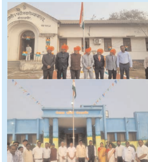
सिटी न्यूज ब्युरो @ मंगरूळपीर

नाथ नगरीत ठीक ठिकाणी प्रजासत्ताक दिन साजरा