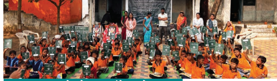
जनपद उदयन वेल्फेअर फाउंडेशन चे उपक्रम

अमरावती : कायम समाजकार्य, शिक्षण, विद्यार्थ्यांचा विकास यासाठी अतिरिक्त कार्य करत असतांना नवीन वर्षांचे अवचित साधत तसेच सावित्रीबाई फुले ज्येतीनिमित्ताने ज्यांना पद उदयन वेल्फेअर फाउंडेशनच्या वतीने ग्राम नेम कुंड तालुका चिखलदरा मेळघाट येथे जिल्हा परिषद प्राथमिक शाळेतील विद्यार्थ्यांना शालेय साहित्याचे वाटप करण्यात आले. कार्यक्रमाची सुरुवात सावित्रीबाई फुले व राष्ट्रमाता मा जिजाऊ यांच्या प्रतिमेचे पूजन हार अर्पण करून जिजाऊ बंदनेने करण्यात आले कार्यक्रमाच्या