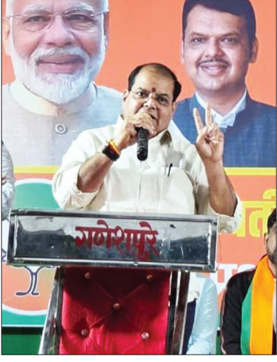
निराकरण करण्यासाठी भारतीय जनता पार्टी कटिबद्ध असल्याचे त्यांनी सांगितले.