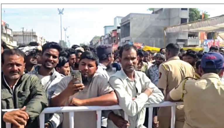
मूर्तिजापूर मतमोजणी केंद्राबाहेर झालेली गर्दी