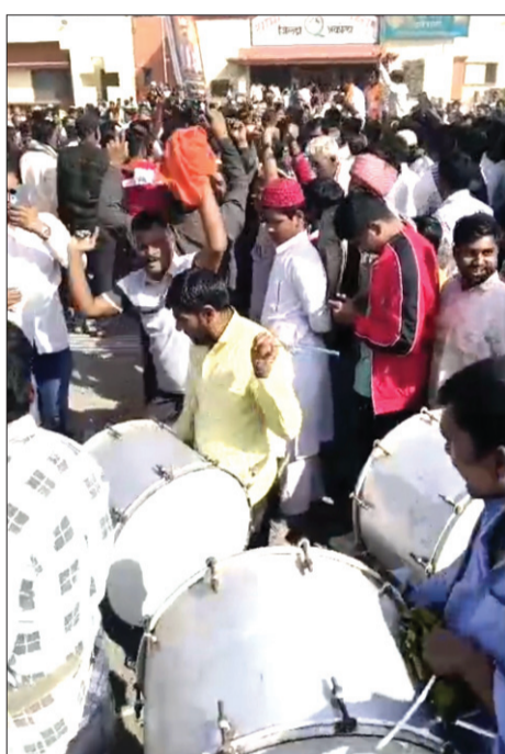
बाळापूर येथे ढोल ताशांच्या गजरात विजयाचा आनंद साजरा करताना समर्थक