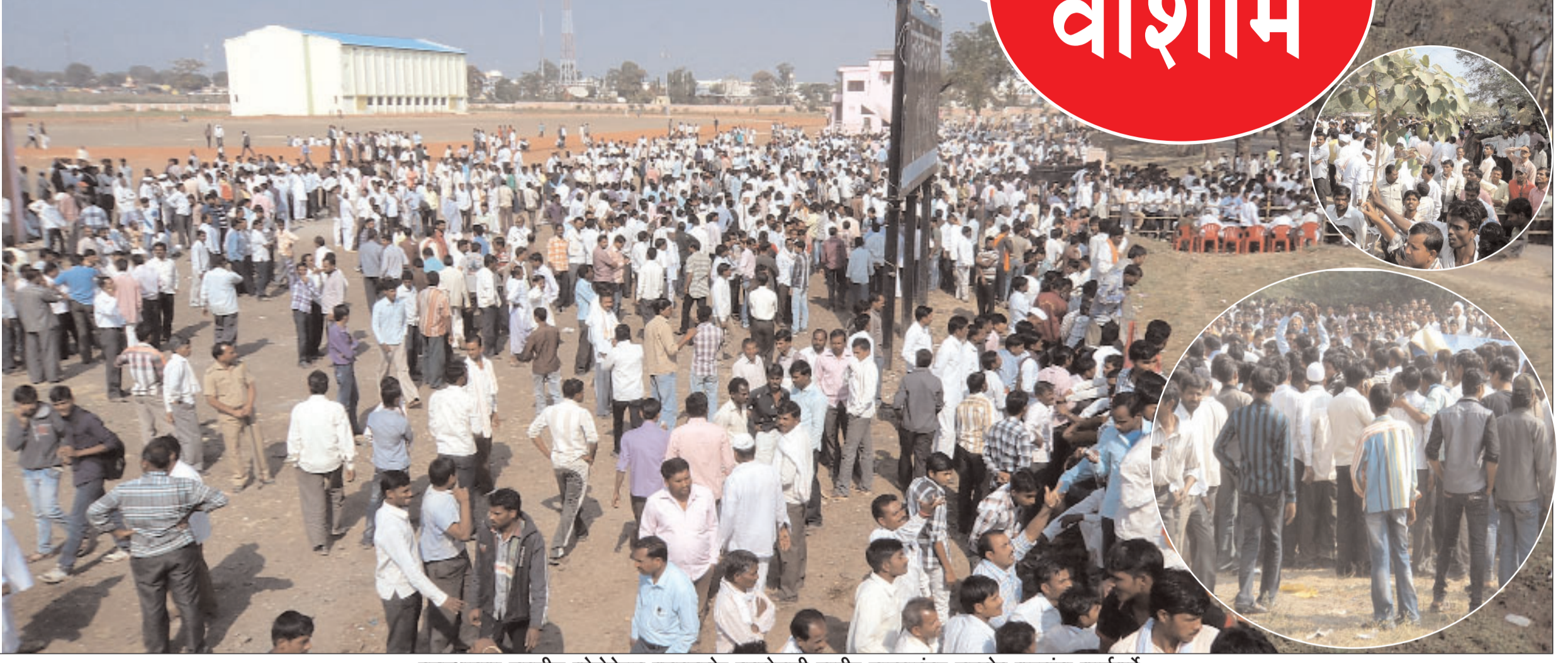
बसस्थानका जवळील कोरोनाशन क्लबसमोर मतमोजणी जाहीर झाल्यानंतर जल्लोष करतांना कार्यकर्ते