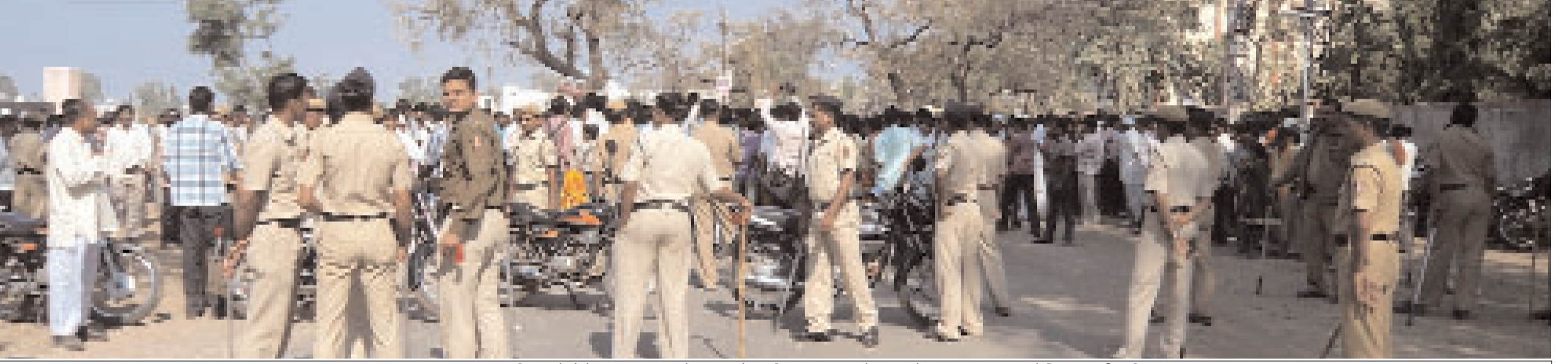
बसस्थानका जवळील कोरोनाशन क्लबसमोर मतमोजणी दरम्यान चोख बंदोबस्त करताना पोलिस कर्मचारी .