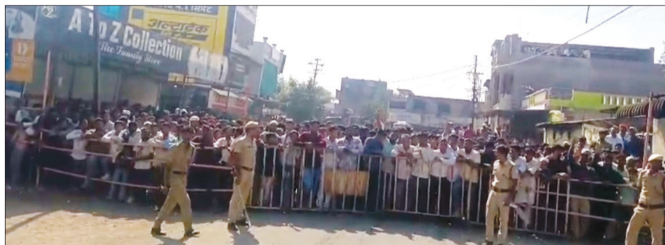
बार्शीटाकळी येथे मतमोजणी केंद्राबाहेर झालेली गर्दी