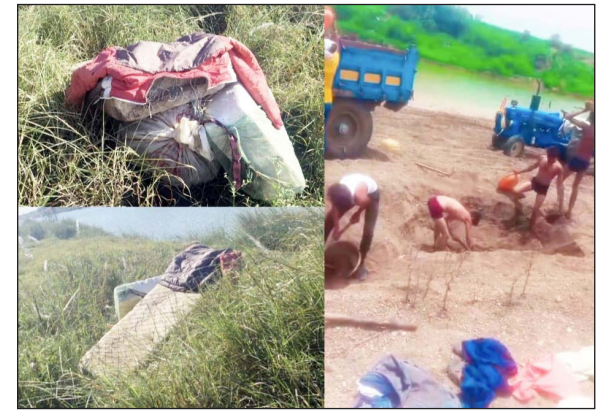
प्रकरणाचा विसर पडल्याने उमरखेडच्या महसूल प्रशासनाची शोपेचे सोंग घेतल्याची टीका होत आहे. काही वर्षांपूर्वी उमरखेड व महागाव तालुक्यांसाठी स्वतंत्र उपविभागीय

प्रक्रियेत रखड झाल्याने तस्करींनी प्रशासनातील काही अधिकाऱ्यांच्या कथित संगनमताने हा गोरखधंदा उघडपणे चालविला आहे. कारखेड रेतीघाटावर कृत्रिम बोटींच्या मदतीने सुरू असलेल्या उत्खननाला संबंधित तलाठी, मंडळ अधिकारी आणि वरिष्ठ अधिकाऱ्यांना माहिती असूनही आर्थिक हितसंबंध जोपासण्यासाठी दुर्लक्ष केले जात असल्याचा आरोप स्थानिकांकडून होत आहे. गावातील सार्वजनिक ठिकाणी रेतीचे मोठे ढिगारे साठवले गेले आहेत. यामुळे कारखेडसह तालुक्यातील इतर नदी-नाल्यांवरूनही अनेक रेती उपसा सुरू असल्याचे निष्पत्ती आहे. महागाव तालुक्यातील वाकोडी