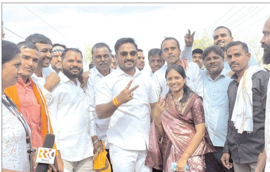
अकोट येथे विजयी जल्लोष