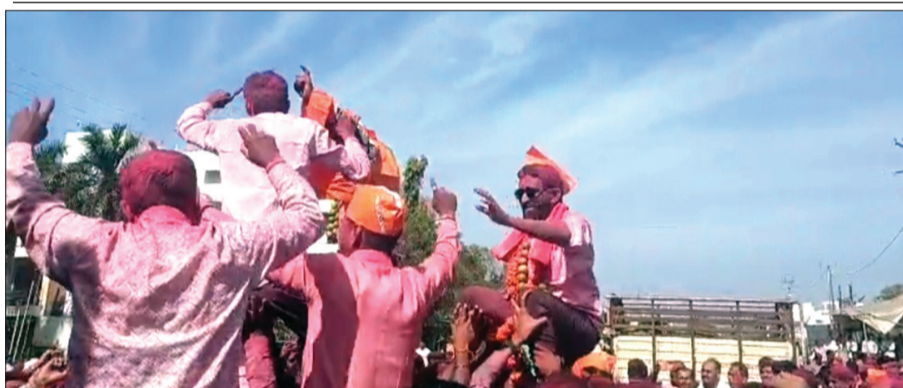
तेल्हारा येथे विजयाचा गुलाल उधळताना