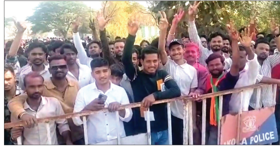
हिवरखेड येथे विजयी जल्लोष करताना कार्यकर्ते